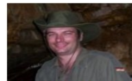
Auteur : Stéphane Mongrain