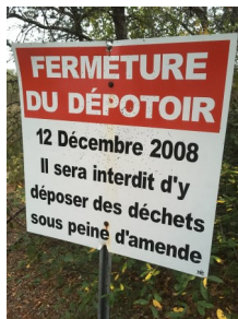
Figure 2. Panneau du dépotoir en tranché du début des années 1980 jusqu'à 2008