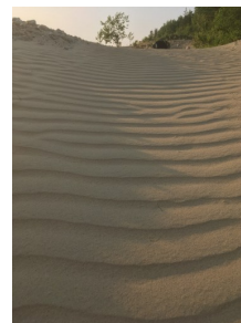
Figure 3. Dunes de sable au pit McDonald