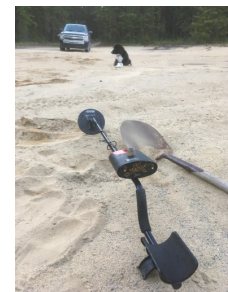
Figure 4. Recherches au détecteur au Pic-Nic des "Fros"