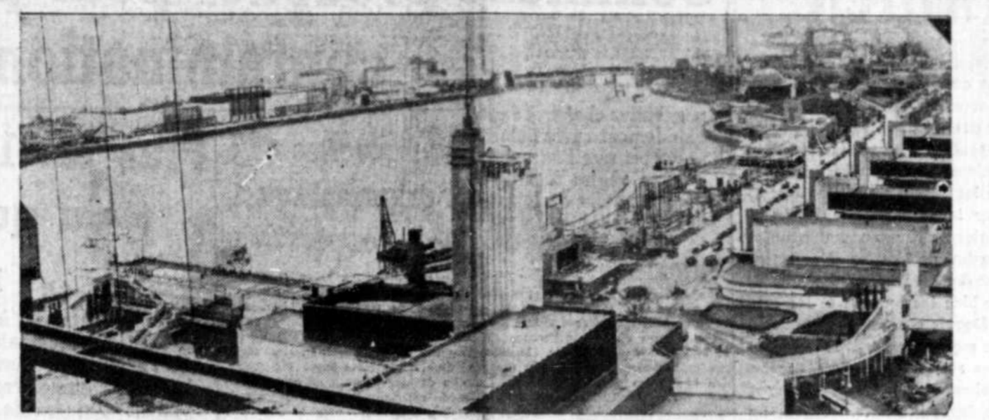
Voici une excellente vue panoramique de la grande exposition mondiale du siècle de Chicago prise de la tour occidentale de la gigantesque promenade aérienne qui s'élève à 628 pieds au-dessus du sol et que l'on peut considérer comme l'une des plus intéressantes attractions de l'exposition. A celle-ci le plupart des pays du monde ont envoyé des exhibits. On s'attend que des millions de personnes venues de tous les coins du monde visitent Chicago cet été.