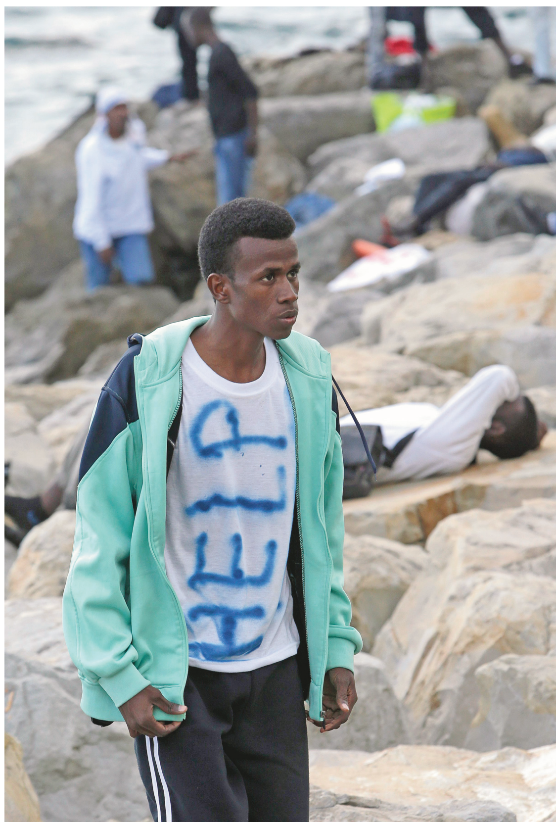
Un jeune migrant, dont le t-shirt affiche l'inscription « à l'aide », attendait à la frontière franco-italienne près de la ville de Menton, dimanche.

François Brousseau est chroniqueur d'information internationale à Radio-Canada. francobrousseau@hotmail.com