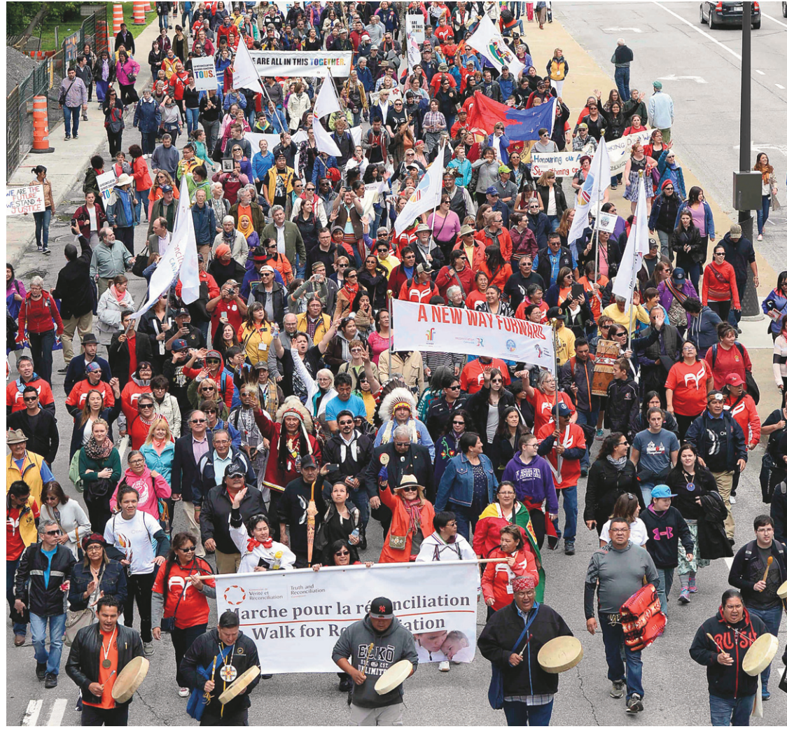
La Marche pour la réconciliation, qui s'est déroulée le 31 mai dernier à Gatineau, faisait partie des événements de clôture de la Commission de vérité et réconciliation.

En effet, le sort fait aux autochtones et la réponse que le Canada y apporte auront alors l'at-