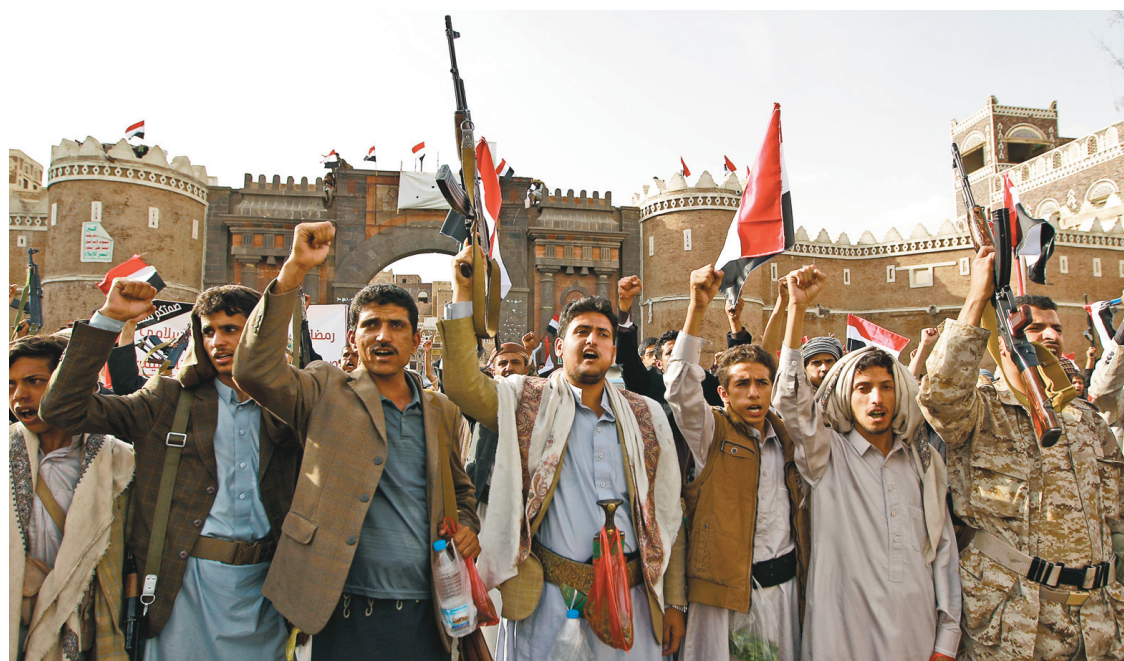
Des partisans des rebelles houthis se sont rassemblés dimanche, dans la capitale, Sanaa.

Pendant une bonne partie de l'après-midi dimanche, la délégation des rebelles, qui comprend des représentants chiites Houthis et leurs alliés du parti de l'ex-président Ali Abdallah Saleh, a refusé de décoller de Sanaa