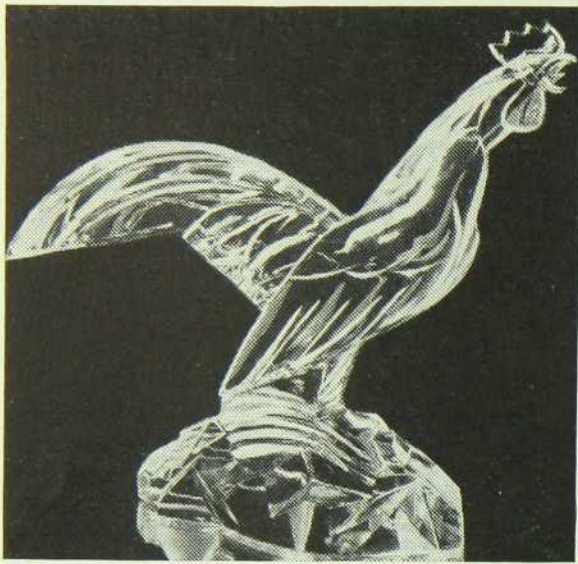
Coq en cristal offert à la Comtesse de Bessborough par les membres de notre Chambre de Commerce.

enseignes qui retinrent l'attention par leur originalité.