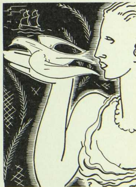
Dessin illustrant le catalogue de l'Exposition

Le salon de l'enseigne avec ses quarante