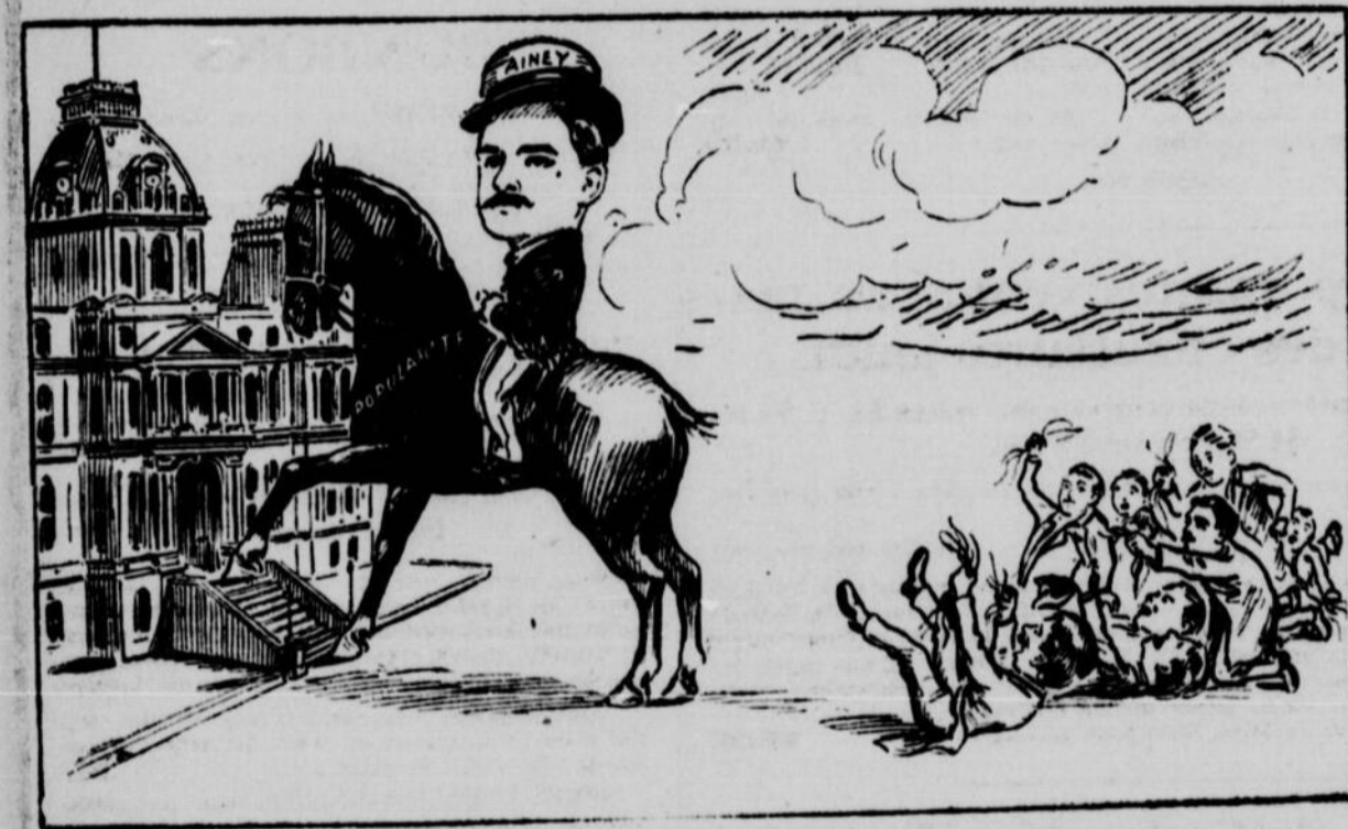
LES CANDIDATS DEFAITS. — Si cette dernière queue ne s'était pas arrachée, nous aurions pu arriver au but en même temps que cet ouvrier.

Le grand succès remporté, hier, par le candidat ouvrier au bureau de contrôle, est sans contredit la plus considérable des victoires que jamais les travailleurs de notre pays n'ont encore obtenue.