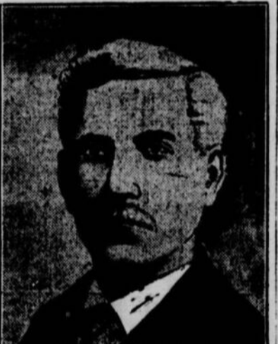
L'hon. M. GRAHAM, ministre des chemins de fer.

Le pont de Québec fait ensuite le sujet de quelques remarques. L'honorable M. Graham dit que l'entreprise est tellement considérable et difficile que les ingénieurs en char-