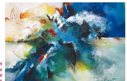
Diane Boulet Jonction de 4 univers Acrylique 30 X 40 pouces