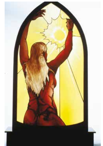
Maurice Gareau, Femme-Lumière, 6,6' X 4' X 15" Tableau d'art en verre gravé et peint, dans un cadre d'acajou