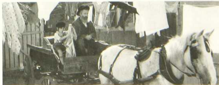
Les Mensonges que mon père me contait

L'annuaire du cinéma canadien de l'Institut canadien du film décrit ainsi le film de Jan Kadar: «Le quartier juif de Montréal en 1925, c'est un réseau de ruelles sur lesquelles donnent des arrières-cours avec leurs immeubles reliés entre eux par des balcons munis d'escaliers où les femmes étendent leur linge et s'interpellent entre elles, tandis que les enfants comme David courent, crient, se disputent et que mille artisans travaillent aux ouvrages les plus variés. Au tailleur qui brandit Marx, le grand-père de David oppose la Thorah, sa seule et unique lecture quotidienne; aux ambitions industrielles de son gendre, il préfère ses profits petits mais sûrs, d'honnête chiffonnier, aux explications scientifiques, ses propres interprétations, qui lui font dire, lorsqu'il pleut, que la terre avait soif et qu'elle a demandé à Dieu de lui envoyer de l'eau. Et puis voici, placé au milieu de ce monde, comme un signe de contradiction, Ferdelah, le cheval qui chaque dimanche tire la charrette emmenant grand-père et petit-fils par les rues de Montréal, avant qu'on ne gagne les pentes fleuries du mont Royal.»