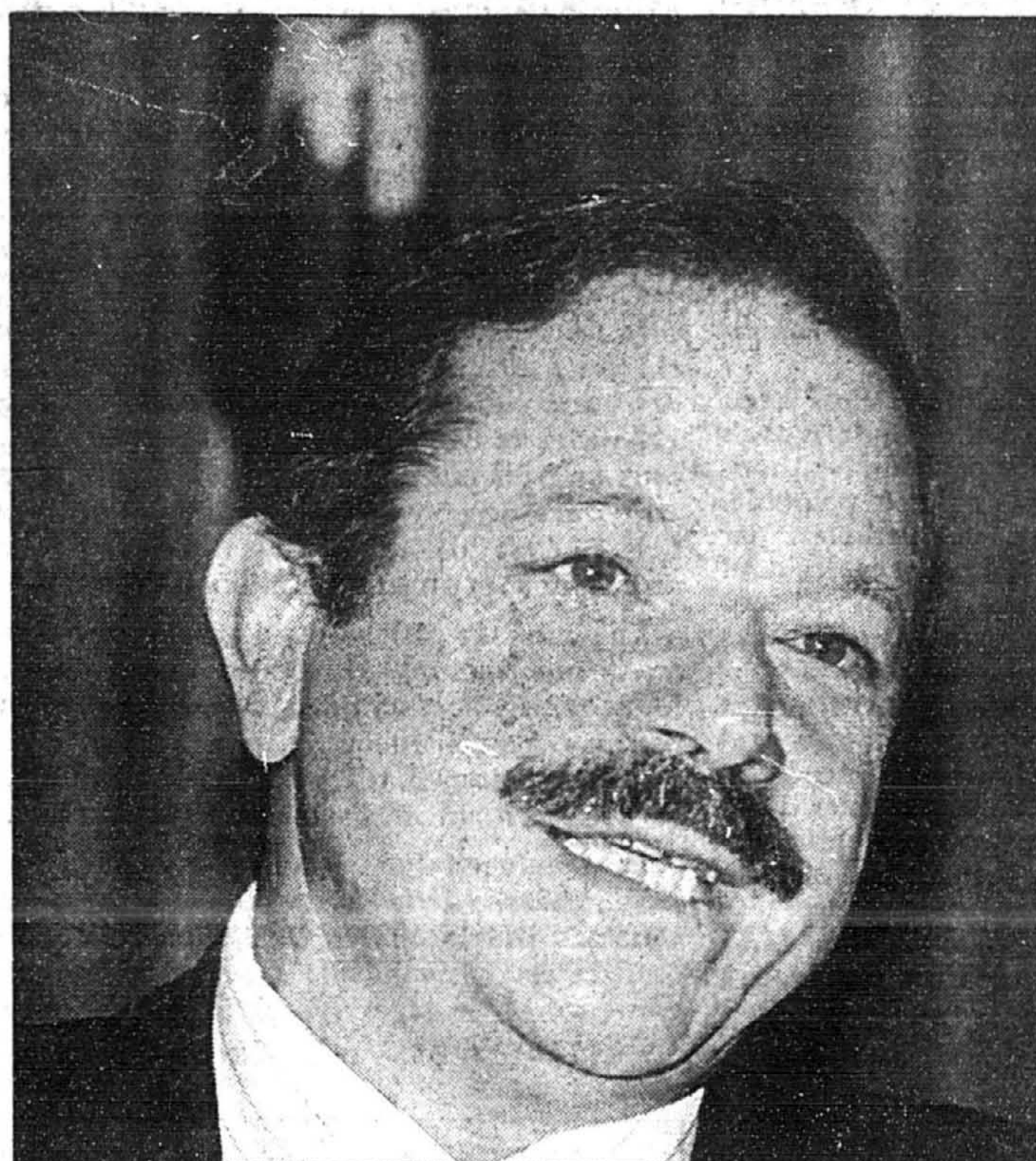
« Le processus de dilution se poursuit », a dit hier le ministre québécois des Affaires intergouvernementales, Jacques Brassard.

constitutionnaliste comme Jacques Frémont estime que le texte de Calgary pourrait inciter les tribunaux à