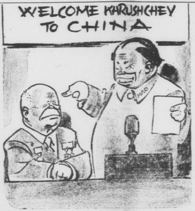
MAO: STIAMO PER RAGGIUNGERVI E VI SORPASSEREMO!

Se gli slavo-ebrei ed i siriani, per non citare che casi di piccole minoranze e che sono pochissime migliaia, hanno potuto compiere il loro nido, noi, nei venti volte più numerosi, possiamo compiere il nostro. NICK