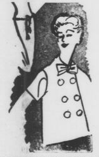
Un nuovo modello di giacchetta cori, per i primi giorni autunnali, molto adatta per le giovani donne in stato interessante.