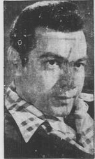
Mario Lanza, il grande tenore italo-americano, morto recentemente in una clinica romana. Aveva 38 anni.

Un fatto sintomatico della mediocrità dei programmi televisivi del canale 2, lo ritroviamo nelle "slogans" in voga tempo fa, nel corso del gigantesco sciopero del personale del radio Canada: "Almeno ora - si diceva - sono costretti a programmare un film dietro l'altro e capita di vederne anche di belli!"