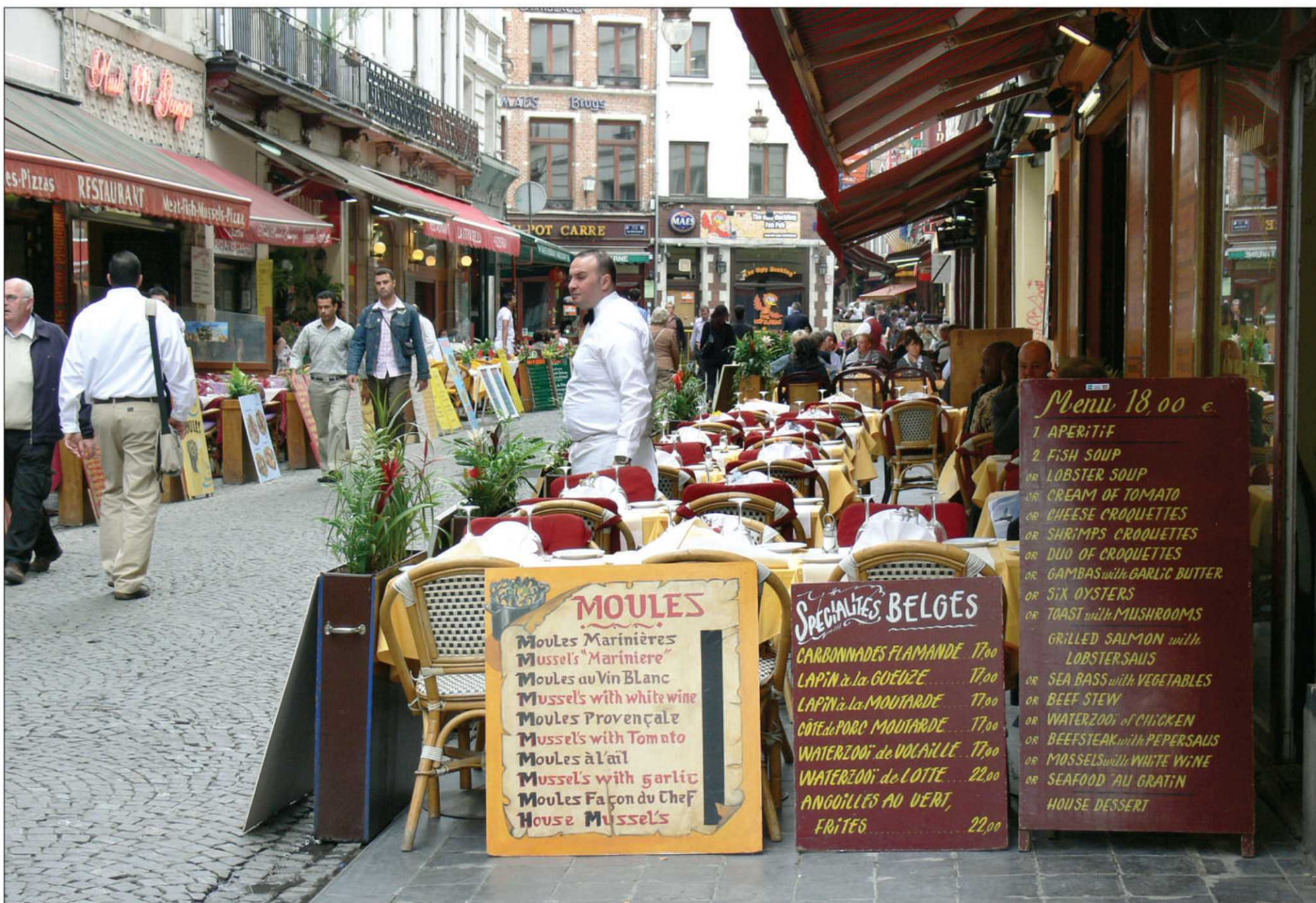
Le centre de Bruxelles déborde d'activités.