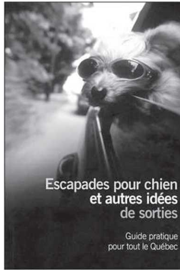
Escapades pour chien et autres idées de sorties

Mais le guide consiste essentiellement en un inventaire régional par région de toutes les commodités disponibles au Québec : les succursales de la SPA (si Fido prend la clé des champs), les vétérinaires d'urgence, les attraites et les randonnées ouverts à Champion et les exigences particulières de chaque établissement hôtelier — y compris les campings — qui accepte les chiens. Et si vous êtes contraints par la présence de Griboille pendant le voyage ou avez tout simplement besoin d'une pause, vous trouverez également dans le guide les pensions qui l'accueilleront pour quelque temps, où que vous soyez dans la province. Jean-Frédéric Légaré