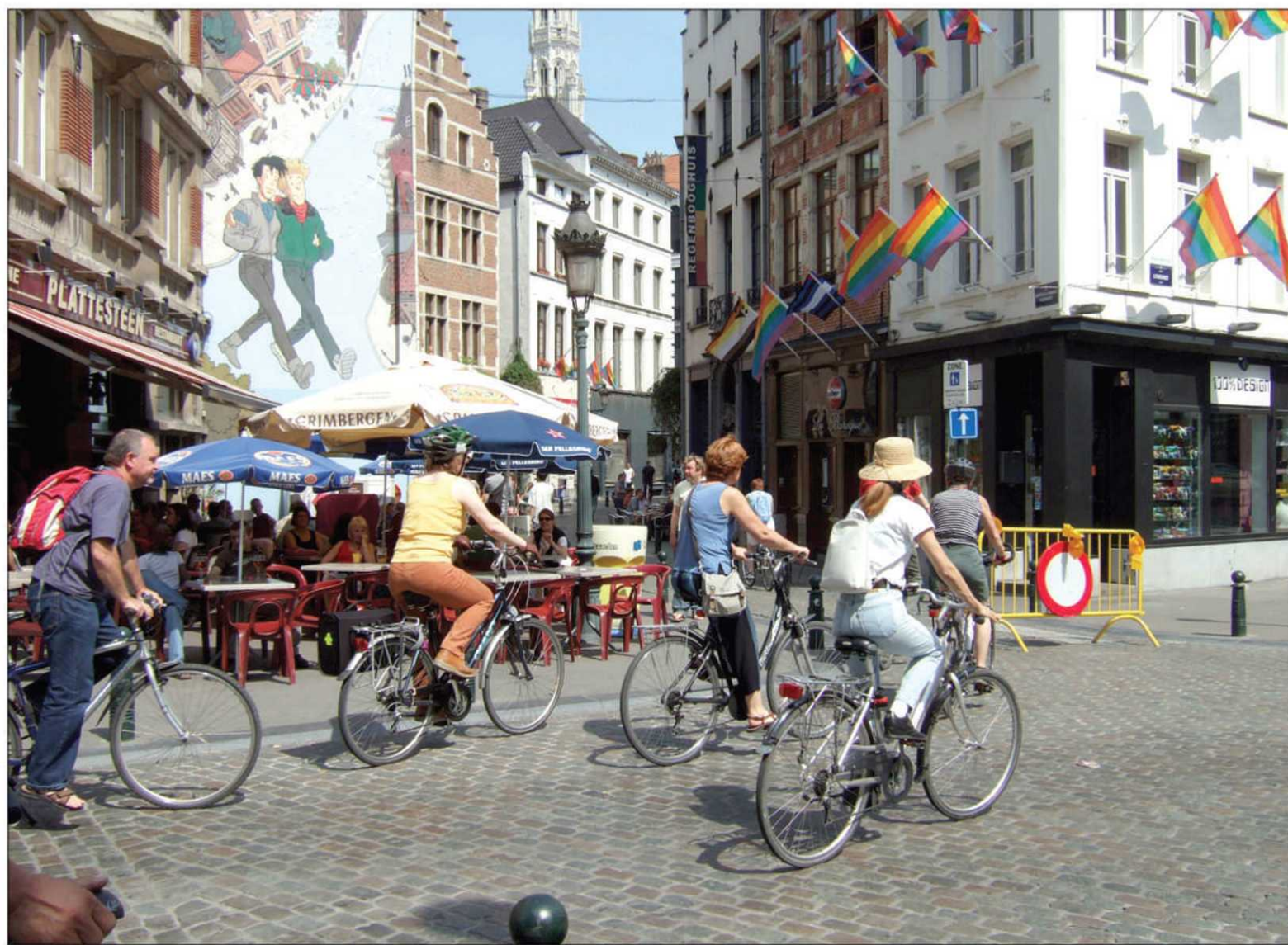
Provélo organise différentes balades à travers Bruxelles sous des angles variés : Bruxelles la nuit, Le Bruxelles des amoureux, Fontaines et sculptures, Art déco et modernisme, La bande dessinée, Bières et brasseries, Trésors de l'art nouveau, Châteaux et abbayes ou Cités jardins.