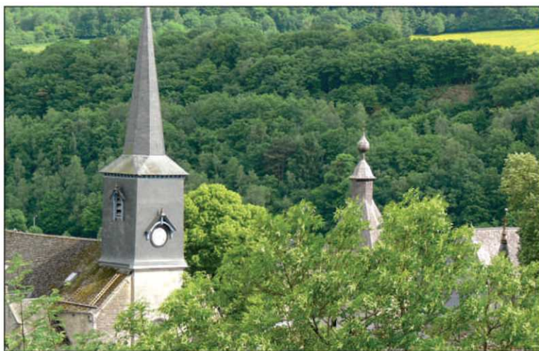
Une vue du village de Vierves, un des plus beaux de la Wallonie. Ce village est connu pour ses procès de sorcellerie tenus aux XVII e et XVIII e siècles, qui sont aujourd'hui à l'origine d'un carnaval.

La visite débute par le circuit guidé d'un village. Les cyclistes parcourent ensuite une cinquantaine de kilomètres par jour. Et le soir, ils logent en chambre d'hôte (transport des bagages assuré).