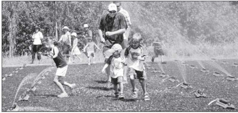
La Poule mouillée amuse petits et grands!