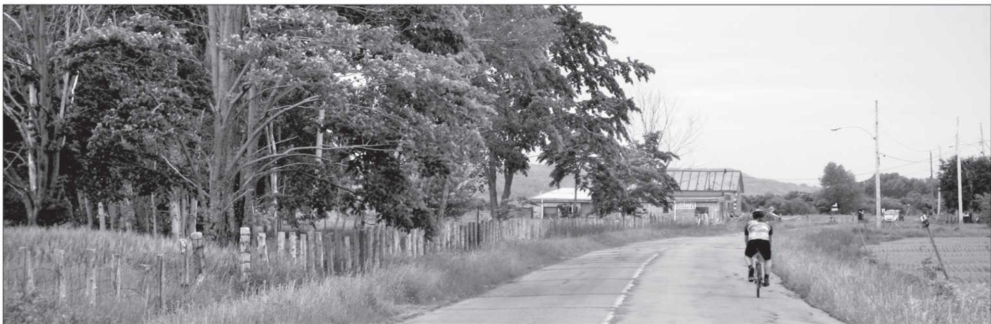
À chaque détour, la véloroute Marie-Hélène-Prémont révèle des lieux charmants.