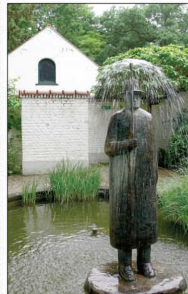
Sculpture dans le jardin de la Fondation Folon

Le village de Fagnolle, niché à flanc de colline, a été qualifié par Jean-Jacques Rousseau de «petit coin de terre où le ciel est toujours beau». Quant à celui de Vierves, où s'arrête un train touristique à vapeur, il est attrayant avec son château et ses maisons de calcaire et de grès alignées sur des ruelles étroites. Ce village est connu pour ses procès de sorcellerie aux XVII e et XVIII e siècles, qui sont à l'origine d'un carnaval. On y trouve encore les bâtiments des lavandières.