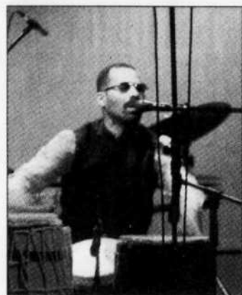
CEDRIC HOUIN - VIRAL.ORG Kahil El'Zabar est considéré comme un des innovateurs les plus prolifiques de sa génération dans le monde du jazz.

Il avait également observé avec attention le rapport de l'artiste à la communauté. Cela allait le servir à son retour à Chicago, destination de nombreux musiciens du delta du Mississippi, alors qu'il devait, en pleine continuité de son histo-