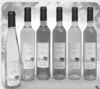
PRODUITS DE LA CIDRERIE