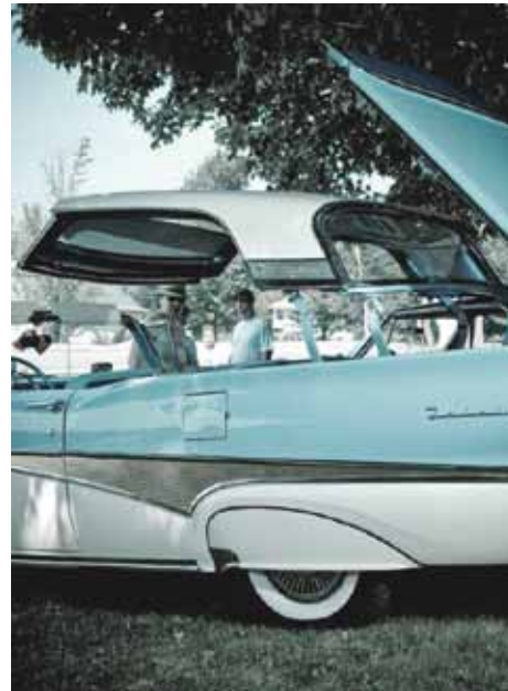
Ford Skyliner 1958.