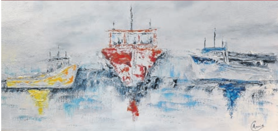
Lors de cette exposition qui se déroule jusqu'au 4 mars prochain au Café Culture de Paspébiac vous découvrirez « La pêche aux harengs ».