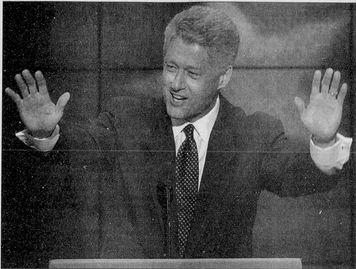
Le président Bill Clinton a officiellement accepté hier soir à Chicago l'investiture démocrate en vue d'un second mandat à la Maison-Blanche. «J'accepte», a-t-il dit, sous les applaudissements des 4200 délégués à la convention.