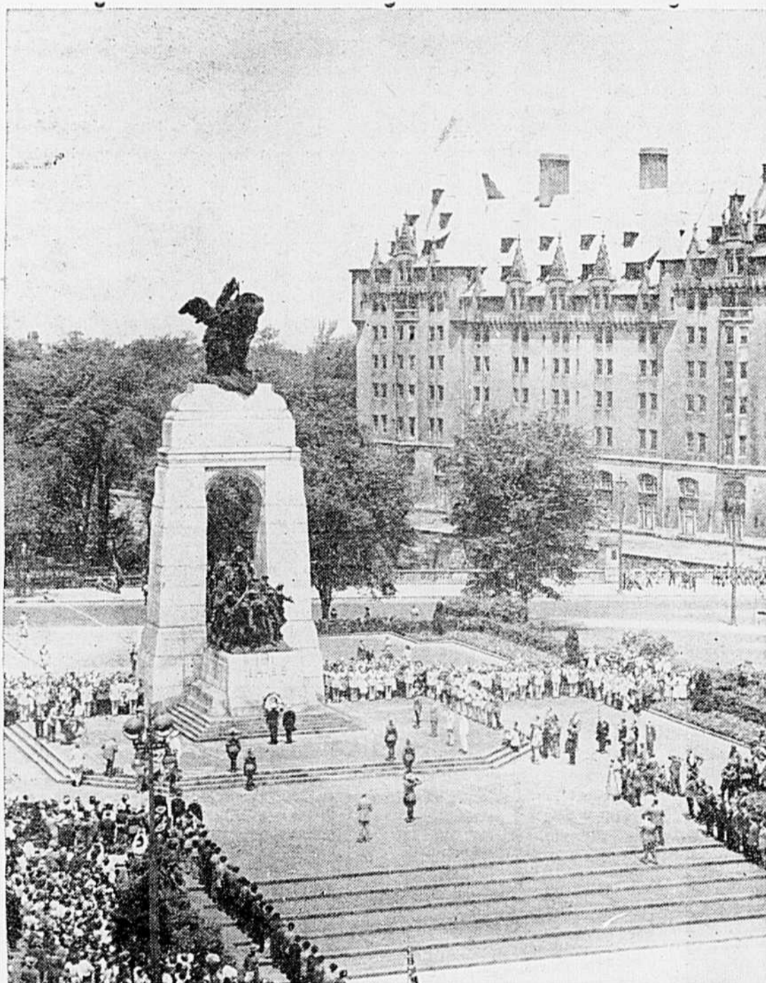
Le président Truman, au cours d'une impressionnante cérémonie, a déposé une couronne de fleurs aux pieds du monument aux morts à Ottawa, peu de temps après avoir adressé la parole aux membres des deux Chambres réunis au Parlement. La photo ci-dessus fait voir un aspect d'ensemble de la cérémonie.