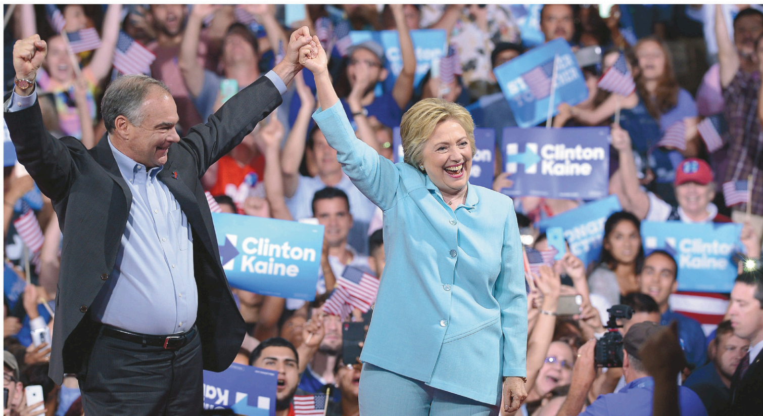
Hillary Clinton (ci-dessus en compagnie de son colistier Tim Kaine lors d'un événement en Floride samedi) devrait s'adresser à la convention jeudi soir. Mardi, les tensions entre les camps démocrates semblaient apaisées.