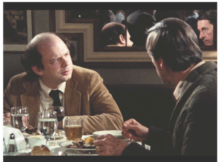
Wallace Shawn et Andre Gregory dans une scène du film

Quel est votre film coup de cœur ? Dans quel contexte l'avez-vous vu ? Pourquoi vous a-t-il plu à ce point ? La série durera tant qu'il y aura des films. En 250 mots environ, la parole est à vous à l'adresse cesfilms@ledevoir.com