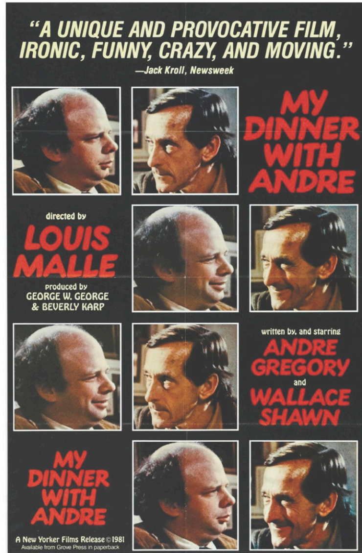
L'affiche originale de My Dinner with Andre

« Dans Atlantic City , je m'amusais à prétendre que le documentaire était fiction. My Dinner with Andre me permettait tout de suite après de faire comme si la fiction était docu-