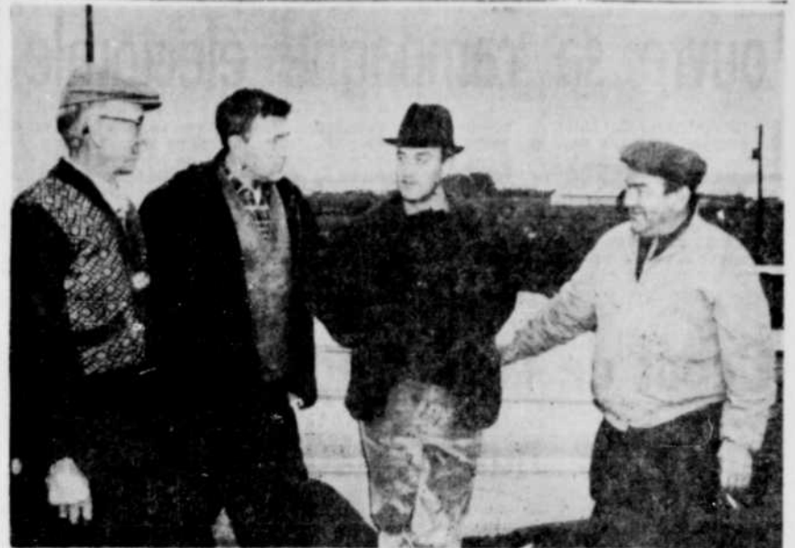
UNE MISSION SPECIALE — Le ministère de l'Agriculture de l'Espagne vient de prévoir l'achat de 4.500 têtes de bétail Holstein d'ici la fin de la présente année...