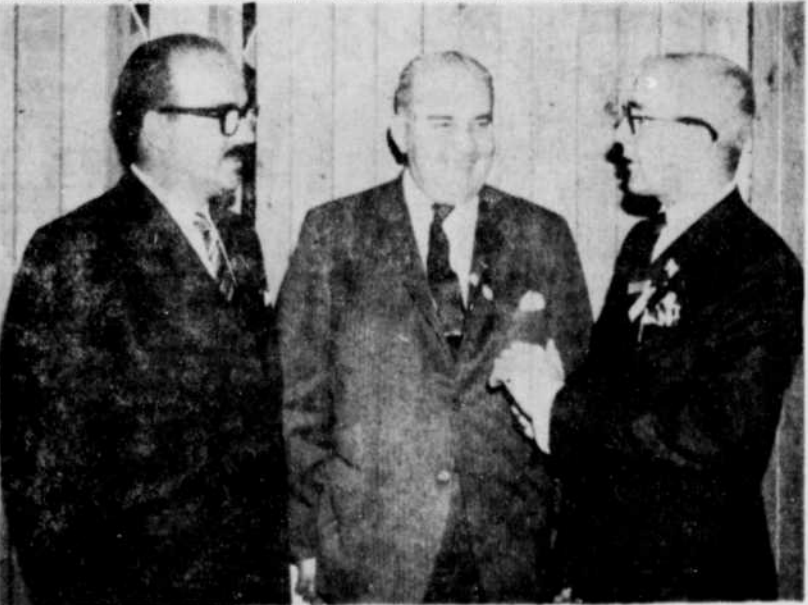
AU BANQUET DE CLOTURE. — Plusieurs personnalités se sont jointes aux délégués du premier congrès de la Coopération des Bois-Francis...