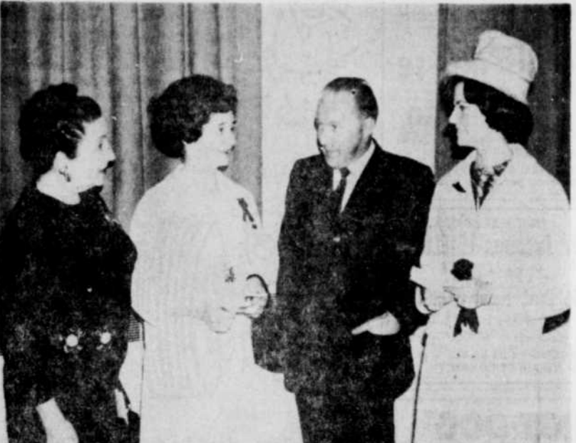
SUCCES COMPLET. — Le premier congrès de la Coopération dans les Bois-Francis a également présenté des activités à succès pour les dames et demoiselles...

VICTORIAVILLE — Le premier congrès régional de la coopération des Bois-Francis a connu des succès inespérés.