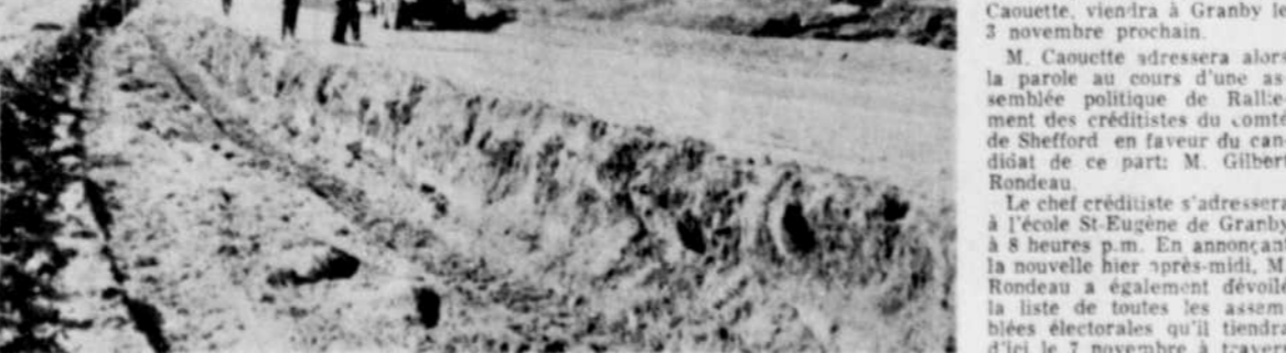
DÉS TRAVAUX ont été entrepris, sur la route 52, à l'entrée de Cowansville dans le quartier de Sweetsburg. La partie de la route qu'on aperçoit sur la photo, sera rehaussée de dix pieds afin de donner à cette route un niveau égal lorsqu'on entrera à Cowansville où l'on en sortira. De plus, en élevant cette route de dix pieds, cette élévation servira en même temps d'accotement au futur bassin qui se trouvera à gauche de la photo.