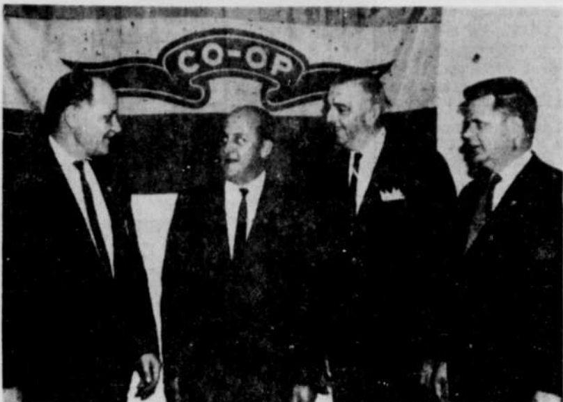
PREMIER CONGRES. — Le premier congrès de la Coopération dans les Bois-Francis a été couronné d'un succès sans précédent...