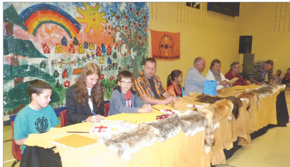
L'entente inter-communauté du projet Harmonie a été renouvelée, le 4 octobre, à l'école Alaqsité'w Gitpu de Listuguj.

« L'école est choyée d'avoir un partenaire comme le CCNB. Tous les élèves et le personnel de l'école tiennent à exprimer leur gratitude envers les gens qui ont travaillé de près ou de loin à cet outil de livraison pour nos petits déjeuners. Merci d'avoir donné si généreusement de votre temps et de votre expertise! » (Source : Nathalie Landry-Comeau)