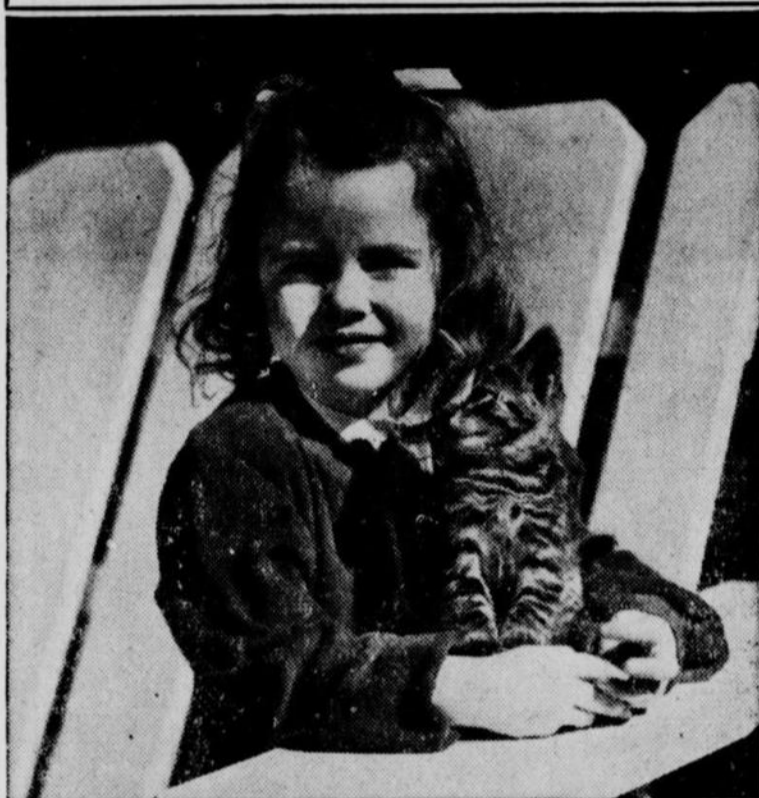
Quelle plus belle photo peut-on faire insérer dans l'album de famille que ce gros plan de la fillette et de son petit chat?