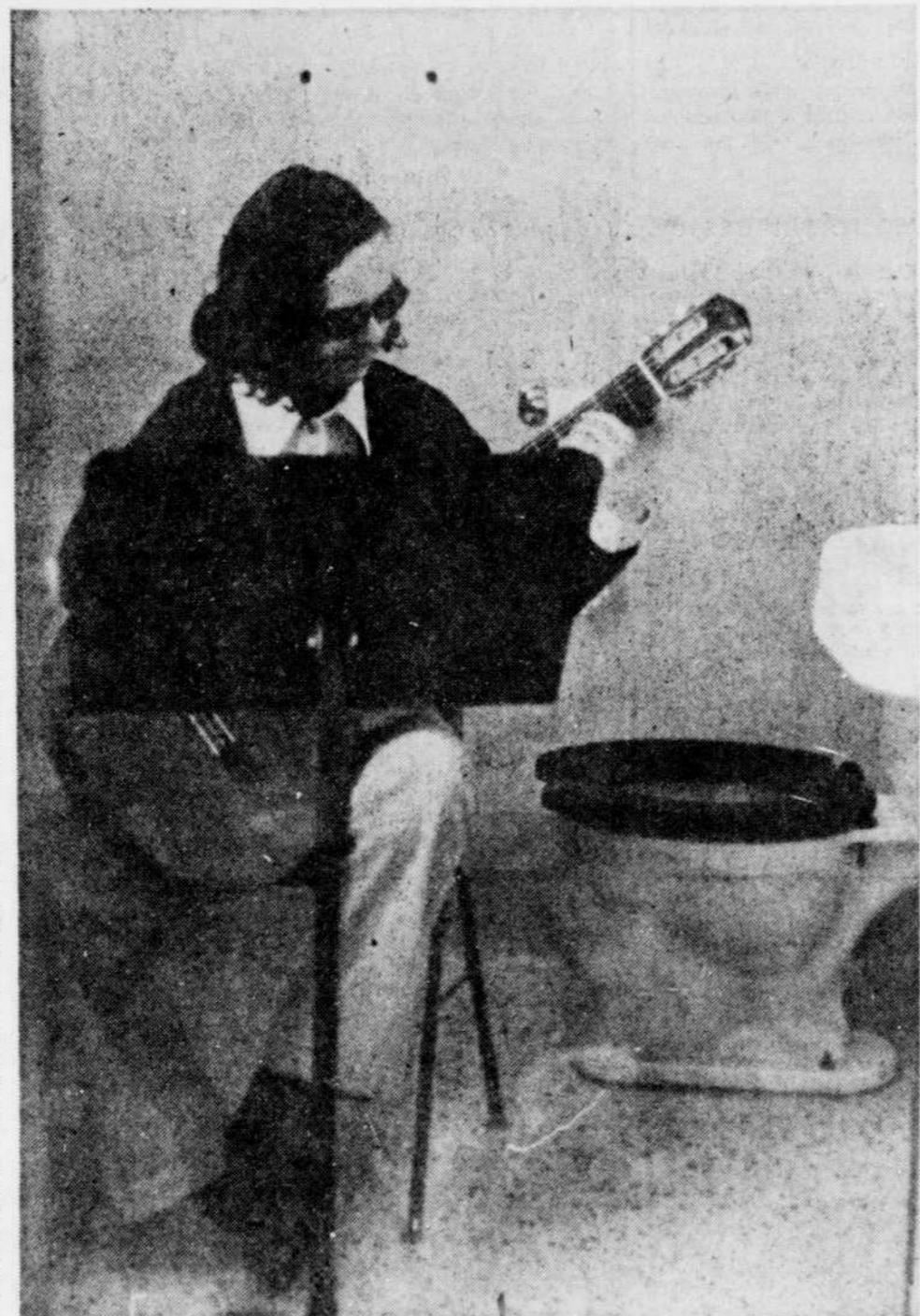
Les étudiants en musique pratiquent là où ils le peuvent...

La deuxième partie qui serait réalisée ultérieurement, comprendrait un pavillon d'éducation physique (gymnase double et piscine semi-olympique) ainsi que deux amphithéâtres et un auditorium.