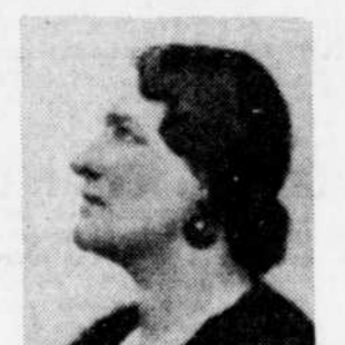
Départ du foyer funéraire J. Bouchard & Fils Ltée 1740 av. Bardy