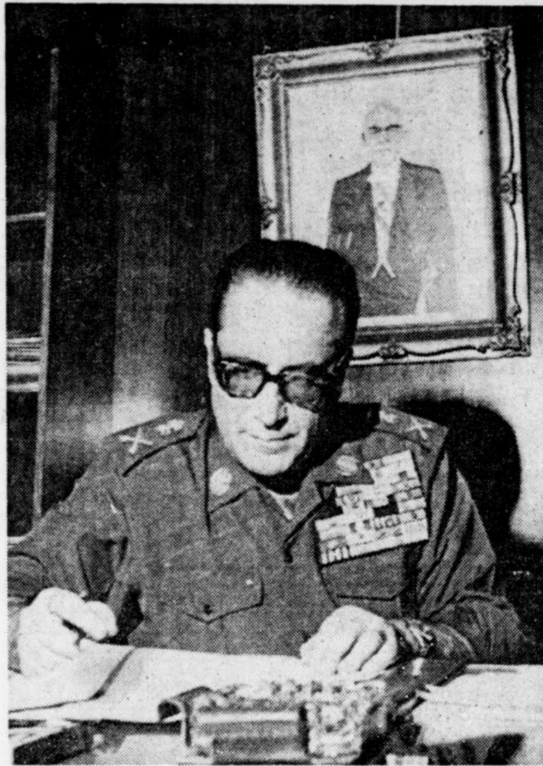
Le "gouverneur militaire provisoire" du Liban, le général Aziz Ahdab, photographié lors d'une conférence de presse à son quartier général. Derrière lui, on peut voir une photo du président Frangié, qu'il appelle toujours "Son Excellence".

BEYROUTH (d'après AFP et AP) — De taille moyenne mais carré d'épaules, le front large et dégarni et portant des lunettes fumées, le général Aziz al Ahdab, plus connu sous le grade de "brigadier" par son entourage, ne s'était jamais mêlé de politique avant le coup de force de jeudi soir au Liban.