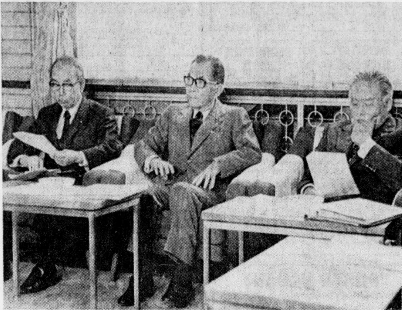
L'affaire des pots-de-vin versés par la société américaine Lockheed à de hauts fonctionnaires japonais embarrasse profondément le gouvernement de ce dernier pays. Ainsi, le premier ministre du Japon, M. Takeo Miki, au centre, a reçu de M. Ford l'assurance que les Etats-Unis feraient tout leur possible pour faire la lumière sur cette délicate question. M. Miki est ici accompagné de M. Takeo Fukuda, premier ministre adjoint, et de M. Masayoshi Chira, ministre des Finances.