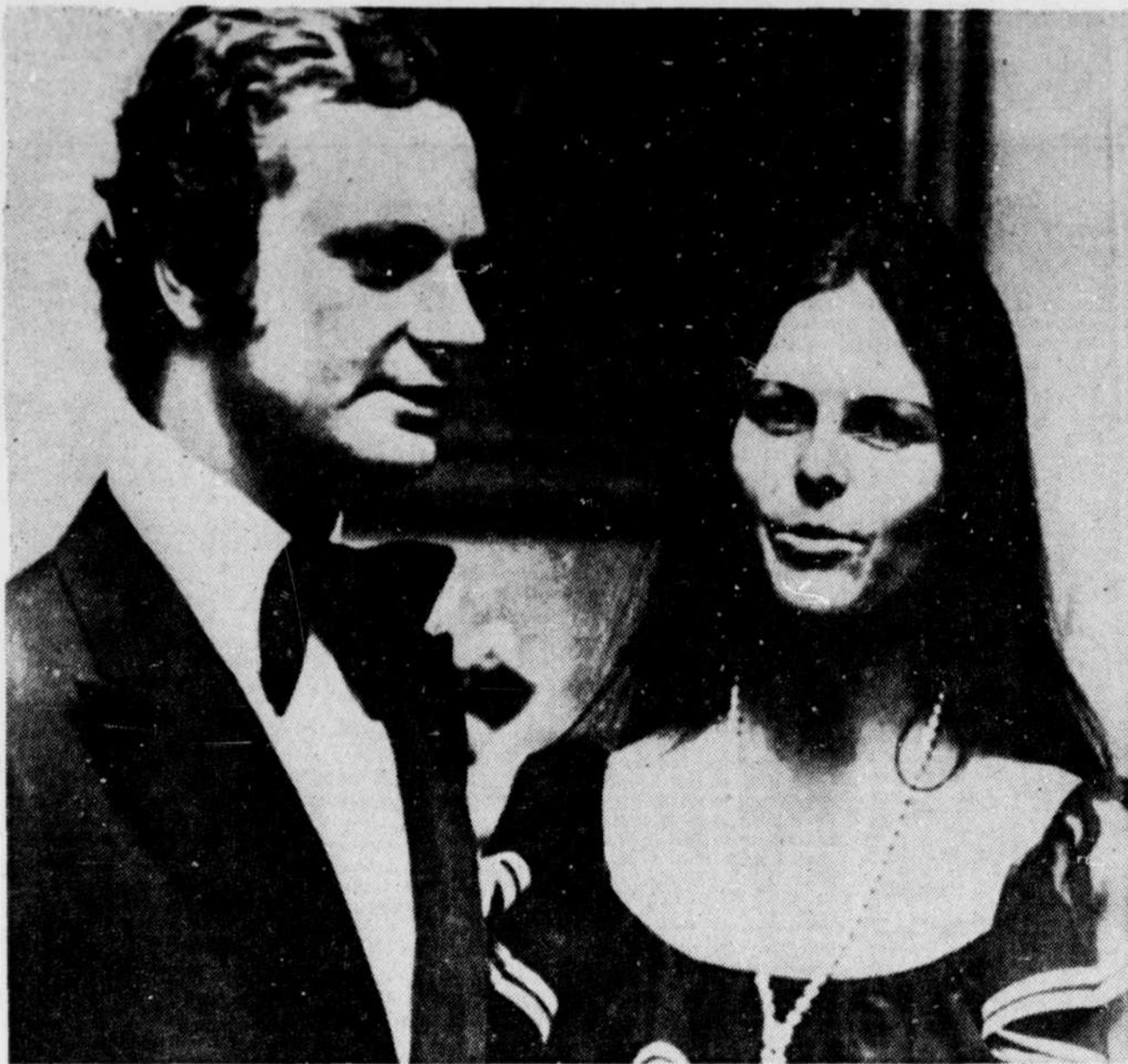
Le roi de Suède Carl XVI Gustave et sa fiancée allemande, Silvia Sommerlath.