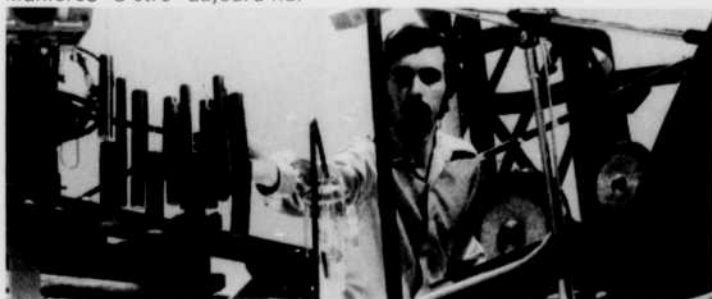
Manières d'être aujourd'hui