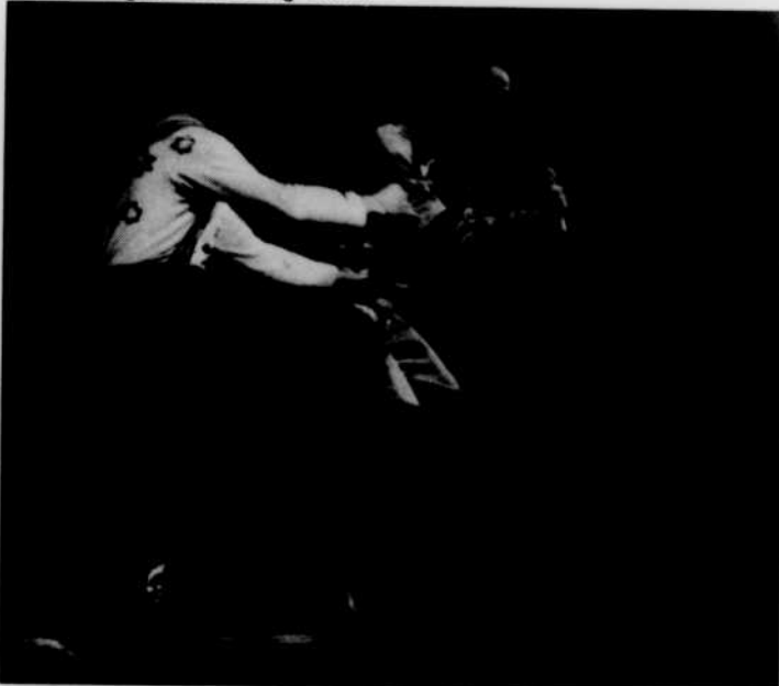
Michel Fugain et le Big Bazar