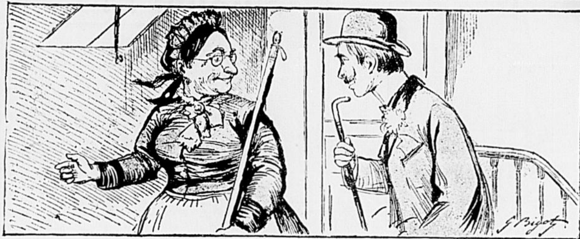
— Dites donc, il n'y a pas de puces au moins dans cette chambre? LA CONCIERGE, amable. — Non, Monsieur, les punaises les ont mangées.