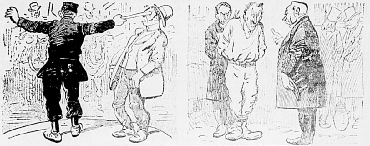
Laissez-moi d'abord arrêter les voitures, je vous indiquerai votre chemin après.

Si Lalonde paie ses voteurs aussi libéralement et avec autant d'éclat qu'il rémunère le cocher qui le conduit au club Lafontaine, il ne manquera pas de créer une "riche" impression!