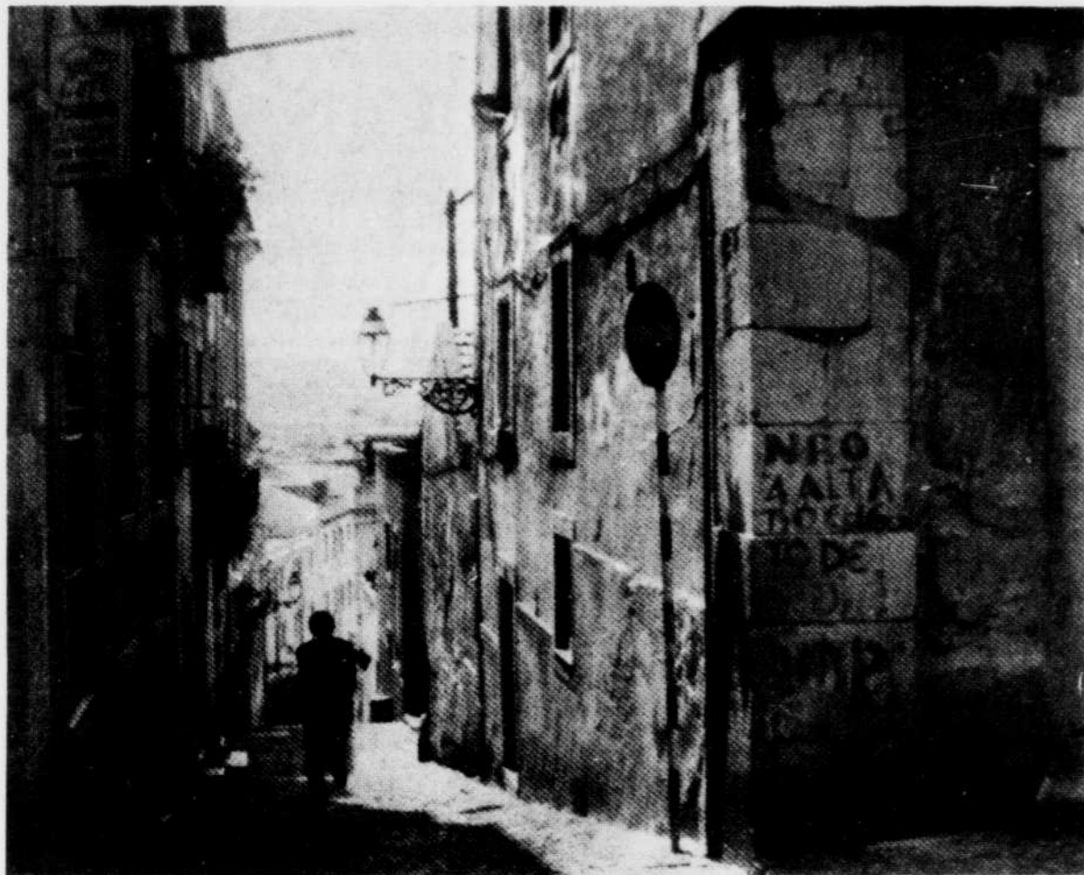
Dans la ville blanche, un film d'Alain Tanner