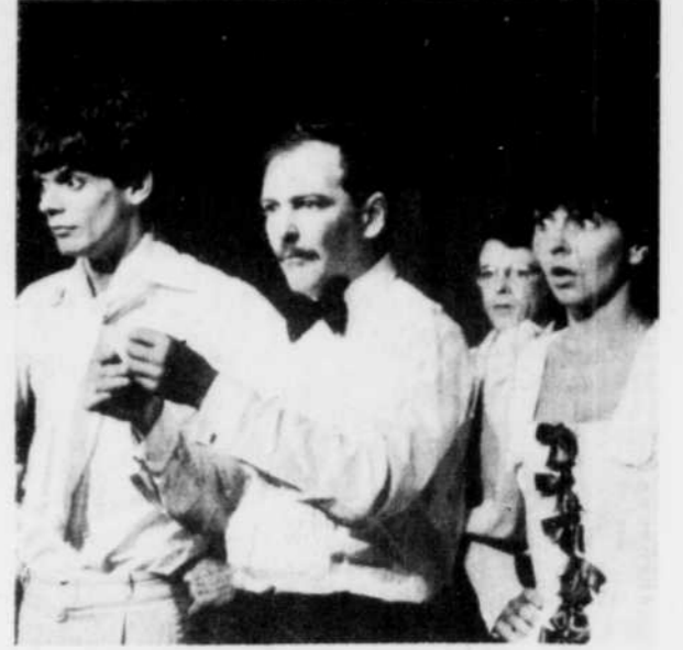
Une scène de J'veux faire mon show