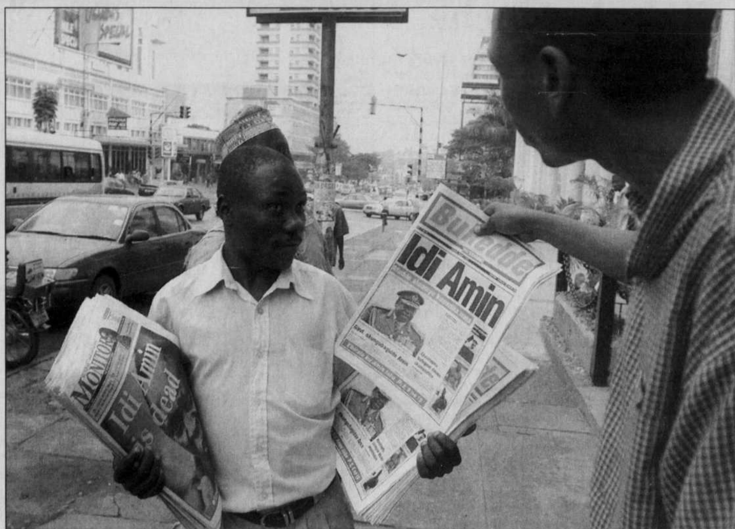
La mort samedi de l'ex-dictateur de l'Ouganda, Idi Amin Dada, a fait les manchettes des journaux de Kampala, la capitale.

L'armée a commencé en outre la construction de deux bases dans le secteur autonome palestinien de Hébron, réoccupé depuis plus d'un an.