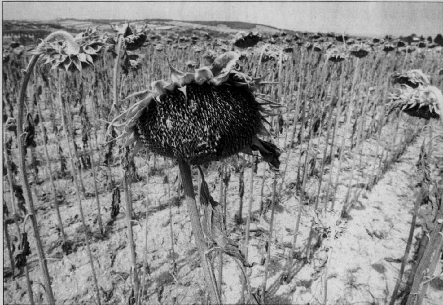
Champ de tournesols près de Toulouse. La sécheresse en France a provoqué des pertes considérables chez les agriculteurs dans à peu près toutes les régions. Seuls les producteurs de vin profitent de la situation.