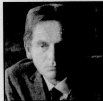
Pierre CARDIN, l'un des invités à «Documents», à 21 heures.