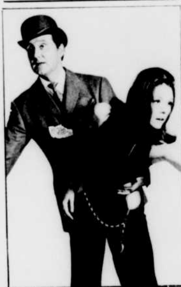
A compter du lundi 22 janvier à 21 heures, «Chapeau melon et bottes de cuir» (Patrick Macnee et Diana Rigg) sera présenté en couleur.