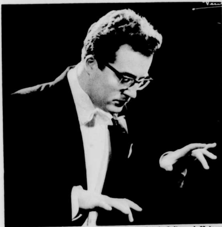
Le pianiste Frans BROUW, avec «L'Orchestre de chambre de Québec», à 20 heures.