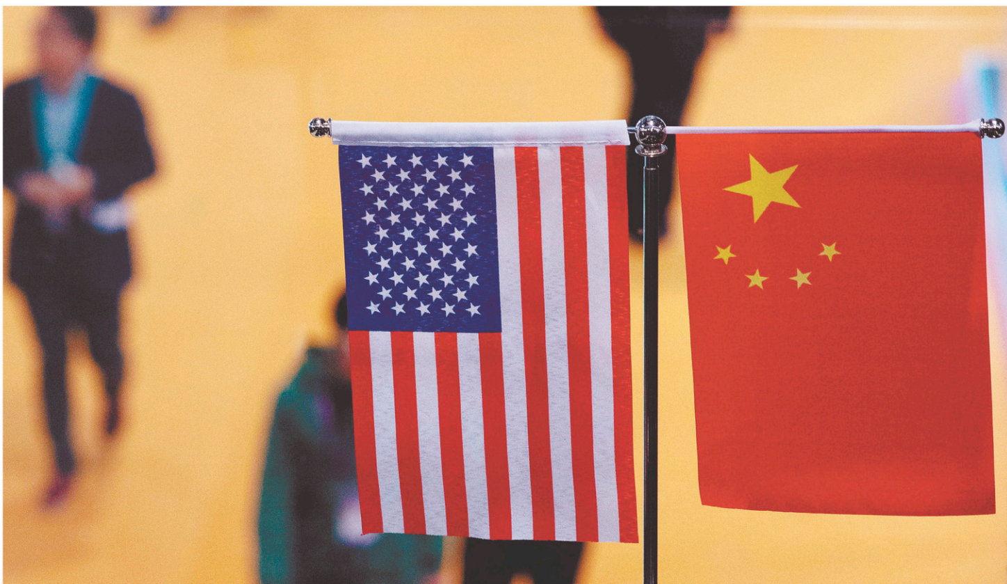
Les États-Unis accusent la Chine « de casser ses prix et d'avoir dévalué sa monnaie de 12% » afin de contrecarrer les tarifs douaniers.

L'on conclut toujours que le resserrement des règles hypothécaires amène cet atterrissage en douceur souhaité du marché de l'immobilier. Les analystes de la Banque Nationale le croient également. « Alors que le taux hypothécaire contractuel a diminué de 68 points de base depuis décembre dernier, le fait que le seuil d'admissibilité n'a diminué que de 15 points de base implique que la plupart des nouveaux acheteurs potentiels évincés [par ces règles] le restent. »