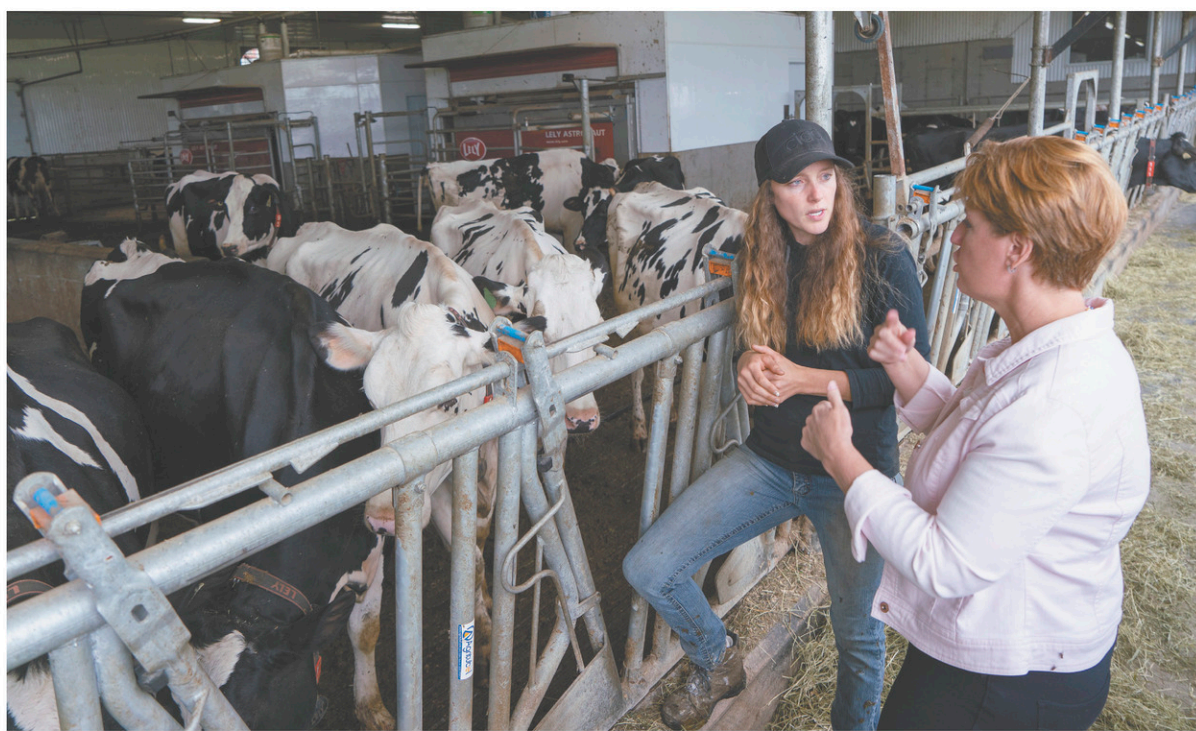
La ministre de l'Agriculture, Marie-Claude Bibeau (à droite), a profité de l'annonce de vendredi pour discuter avec la propriétaire d'une ferme laitière à Compton, en Estrie.

Selon une première analyse faite par les PLQ, l'enveloppe annoncée devrait couvrir environ 70 % des pertes qui dé-