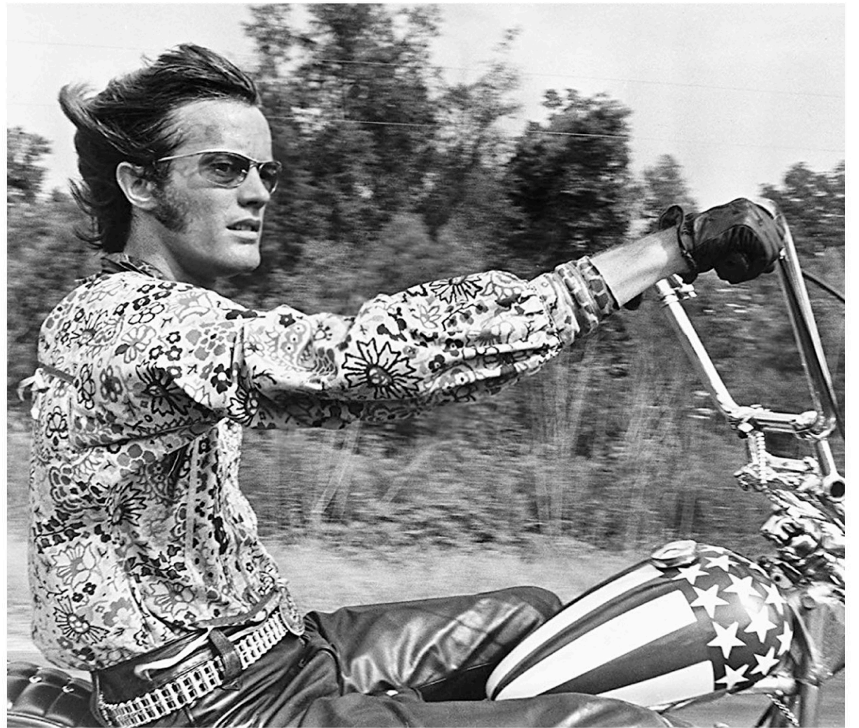
L'image de Peter Fonda, les jambes étendues sur son chopper Harley-Davidson peint aux couleurs du drapeau américain, est emblématique de la contre-culture des années soixante.

Militant écologiste de la première heure, l'acteur avait fait sensation au Festival de Cannes en 2011 lorsqu'il avait qualifié le président américain de l'époque, Barack Obama, de « putain de traître » en lui reprochant sa gestion d'une marée noire dans le golfe du Mexique provoquée par le naufrage de la plate-forme pétrolière Deepwater Horizon.