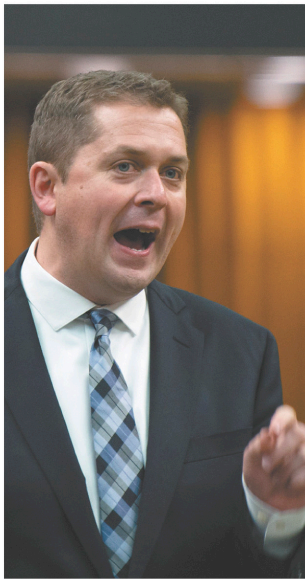
Andrew Scheer a réclamé vendredi une enquête d'un comité parlementaire sur les agissements de Justin Trudeau dans l'affaire SNC-Lavalin.

Le chef du Parti conservateur, Andrew Scheer, réclame la tenue d'une telle enquête par le Comité permanent de l'accès à l'information, de la protection des renseignements personnels et de l'éthique. Cette requête survient après le dépôt cette semaine du rap-