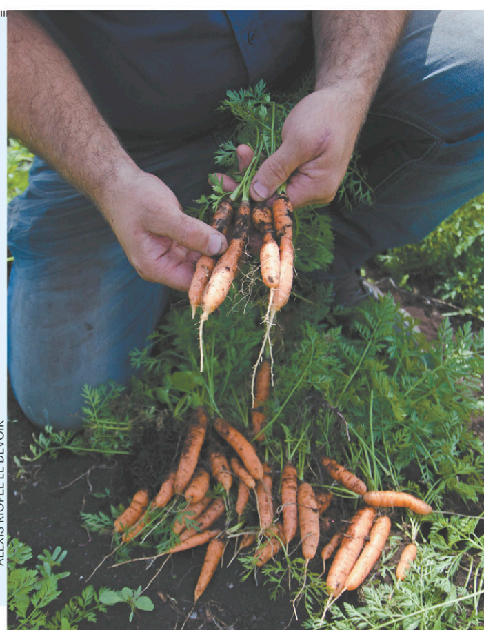
ALEXIS RIOPEL LE DEVOIR