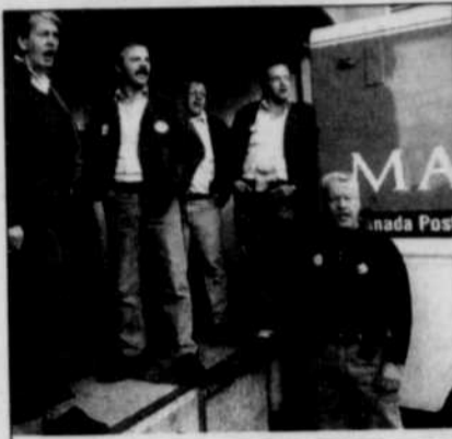
LE SOLEIL, PATRICE LAROCHE Le port des jeans: un moyen de pression désormais abandonné.

Le ministre canadien du Travail doit décider, d'ici le 7 octobre, s'il donnera le droit de grève et de lock-out ou s'il donnera la poursuite des négociations par la nomination d'un conciliateur.