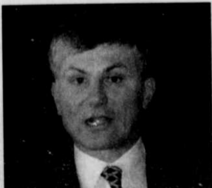
Le maire de Belgrade, Zoran Djindjic.

Sur les 68 conseillers présents, 67 se sont prononcés pour la démission de Zoran Djindjic, dont ceux du Parti du renouveau serbe de Vuk Draskovic, l'ex-partenaire du maire de Belgrade