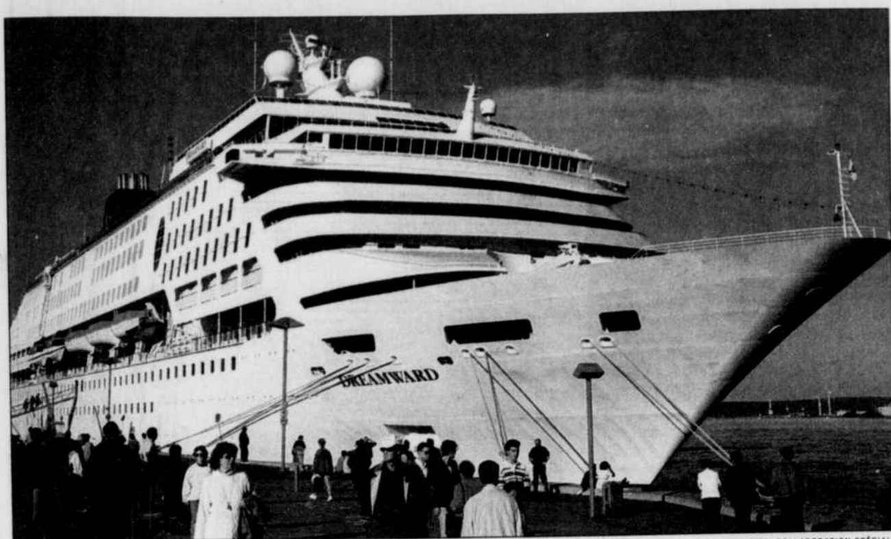
Le Dreamward amarré au port de Québec, durant le week-end dernier.