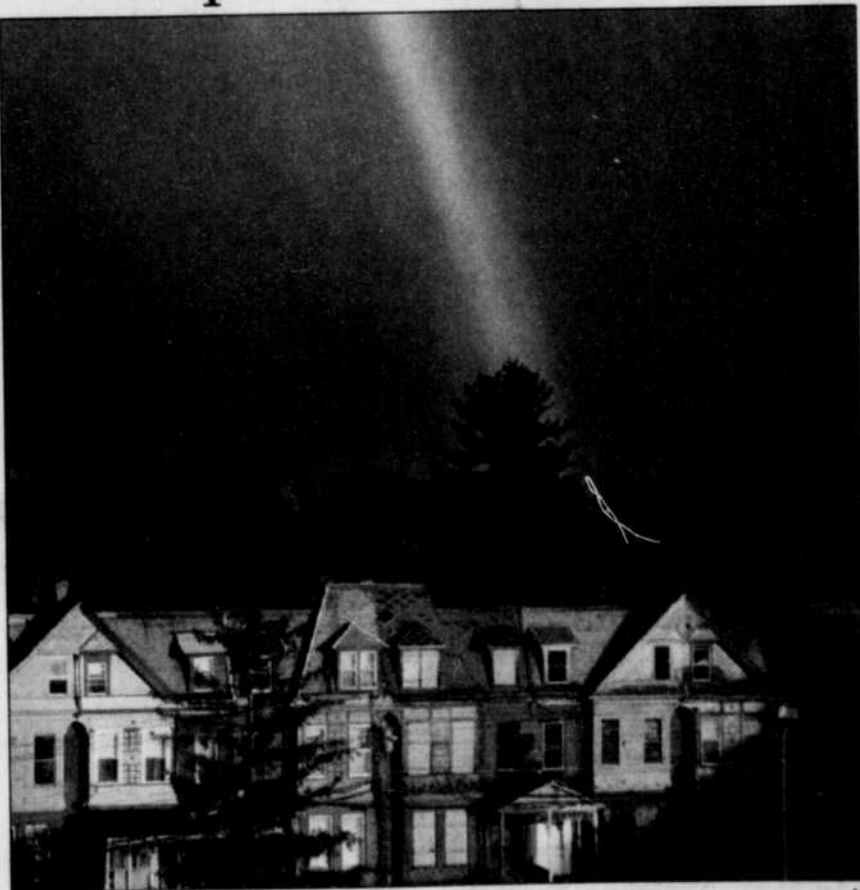
Un arc-en-ciel d'une beauté remarquable pointait dans le ciel de Poughkeepsie, N.Y. Tout simplement féérique.

JE NE SAIS PLUS OÙ VOTER! J'AI UN CHALET DANS LES LAURENTIDES, UNE MAISON À OUTREMONT, UN APPARTEMENT À QUÉBEC, UN CABANON À ST-HENRI ET UN ABRÍ TEMPO DANS LE STATIONNEMENT DE LA C.S.N. !!!