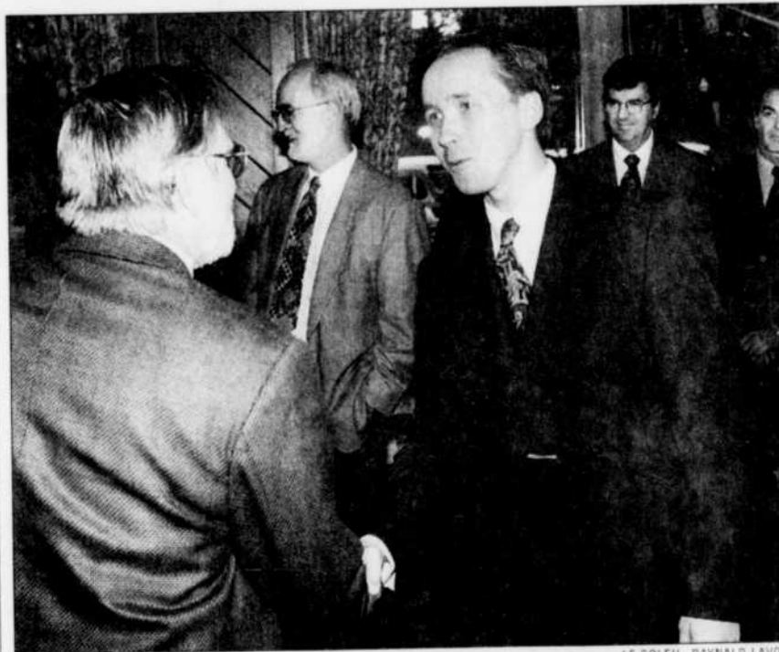
Le ministre Bélanger (à droite) a rencontré, hier après-midi, tous les maires de la grande région de Québec intéressés par GRICO.

Depuis janvier, GRICO a passablement diminué le sentiment d'insécurité qui régnait dans les bars. Au début de la semaine, les 1018 descentes effectuées dans les établissements licenciés avaient permis d'arrêter 676 personnes. Trente-trois dossiers litigieux ont été soumis à l'attention de la Régie des alcools, des courses et des jeux, qui a révoqué 15 permis et en a suspendus 11 pour des périodes plus ou moins longues. Les policiers ont constaté 341 infractions à la loi régissant les boissons alcoolisées, effectué 155 perquisitions menant à la saisie de stupéfiants, récupéré 23 armes et ramassé 139 000 $ émanant d'activités criminelles.