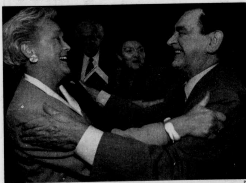
La ministre Pauline Marois a annoncé, hier, qu'à partir de 1999, les élèves du Québec, recevront plus d'heures de langues, de mathématiques et d'histoire. Elle reçoit ici, les félicitations de son collègue Camille Laurin. Détails en page 10.