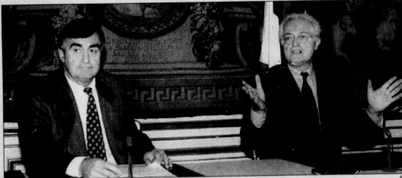
Le premier ministre Lucien Bouchard et son homologue français, Lionel Jospin.

« Le Figaro » était encore hier matin, le seul autre quotidien à s'être intéressé à la visite de M. Bouchard à Paris. Le quotidien de droite, qui a publié plusieurs articles et une interview du premier ministre, dresse un portrait favorable de l'économie du Québec.