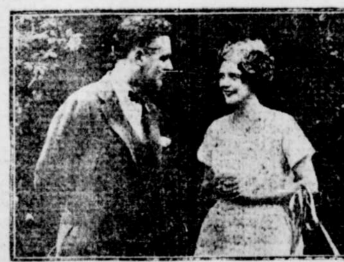
Les fameux acteurs de cinéma MARSHAL NEILAN et BLANCHE SWEET photographiés au moment de leur départ pour leur voyage de noces.