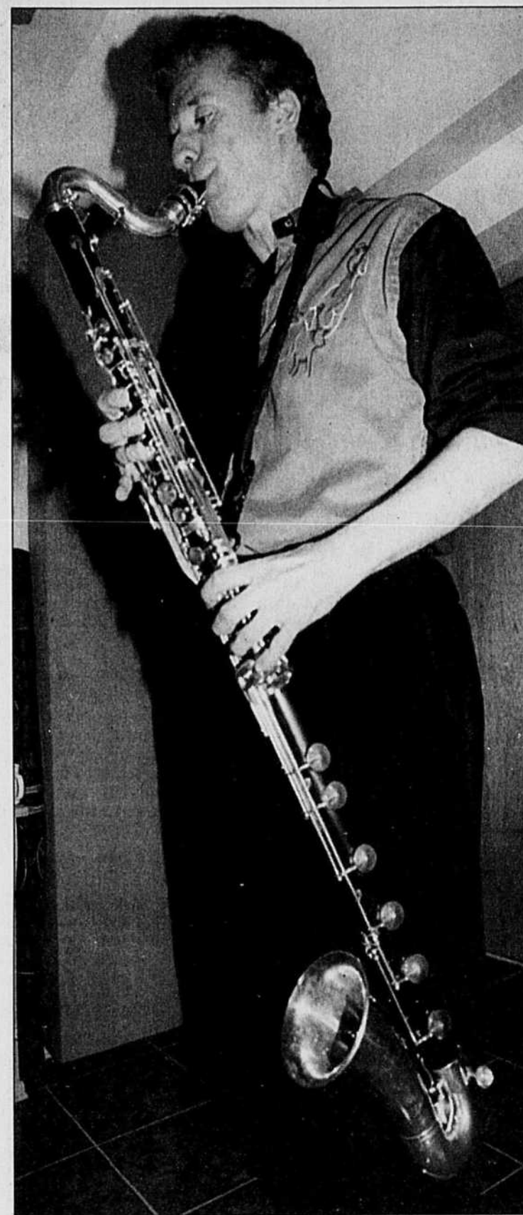
Robert Marcel Lepage se produira demain et jeudi au théâtre La Chapelle.

Cette fois, c'est tout à fait officiellement qu'Isaac Stern séjourne dans le pays de l'horreur nazie et de l'Holocauste. Avant de prendre jeudi prochain la direction de son atelier de musique de chambre à Cologne, il effectue depuis hier dernier un pèlerinage musical à Berlin, Dresde, Leipzig et Bonn, «les villes où Bach, Beethoven et Mendelssohn ont vécu, travaillé et aimé, des compositeurs qui, de tous temps, ont été partie intégrante de ma vie».