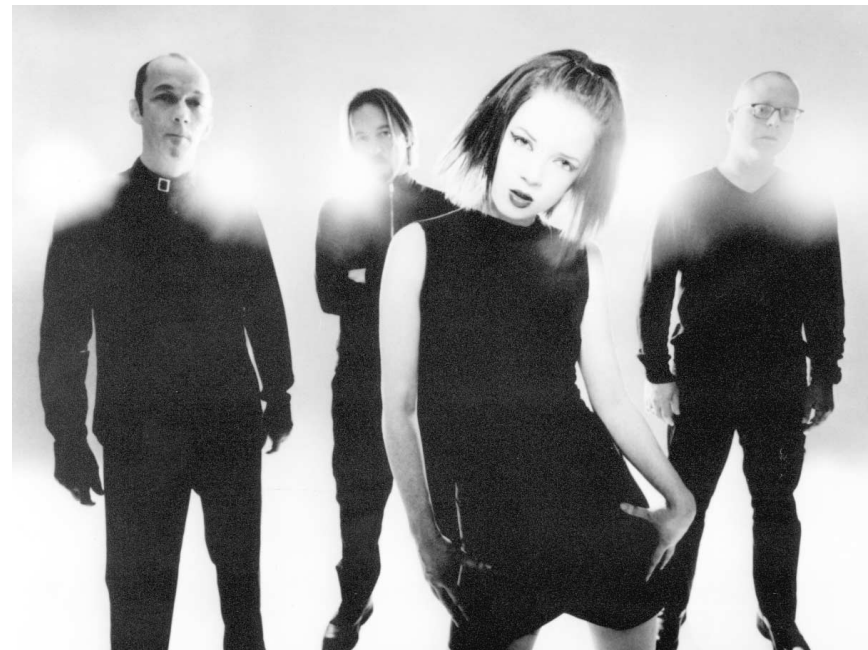
Duke Erikson, Butch Vig, Shirley Manson et Steve Marker, de Garbage, seront en spectacle demain soir en première partie de U2.

Une exploration sonore qui, si elle demeure fidèle à l'esprit du groupe, ne manquera pas de dérouter quelques fans. D'abord, parce que les guitares sont moins présentes. Deuzio, Garbage tire dans toutes les directions, ce qui donne un