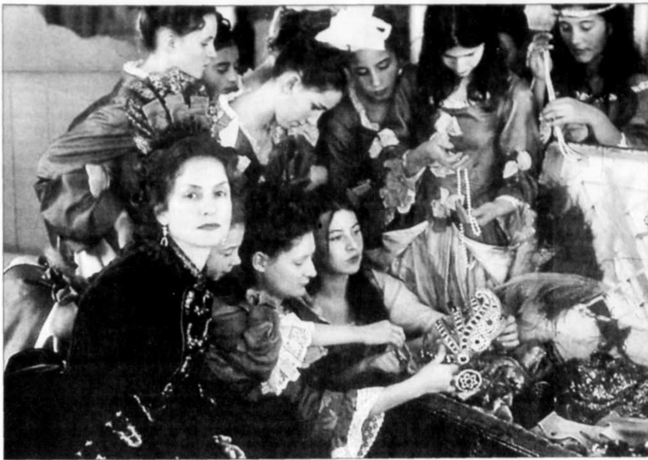
Isabelle Huppert domine le film sans écraser les jeunes actrices qui partagent la vedette de « Saint-Cyr », contrairement à Madame de Maintenon, la meneuse charismatique et démente qu'elle incarne. On l'a déjà vue plus bouleversante.