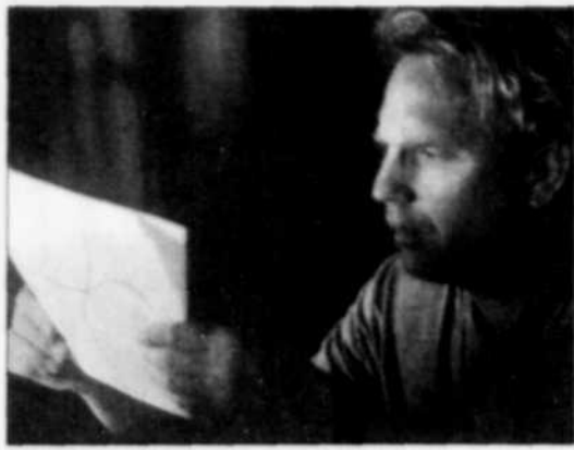
« Libellule » offre le spectacle désolant d'un acteur sur le déclin. Kevin Costner a-t-il réellement cru qu'une petite saucette dans le surnaturel allait ressusciter sa carrière ?

Réalisé par Tom Shadyac, spécialiste de la comédie vite vue, vite oubliée ( Ace Ventura, Menteur, menteur ), Libellule redonne tout son sens à l'ex-