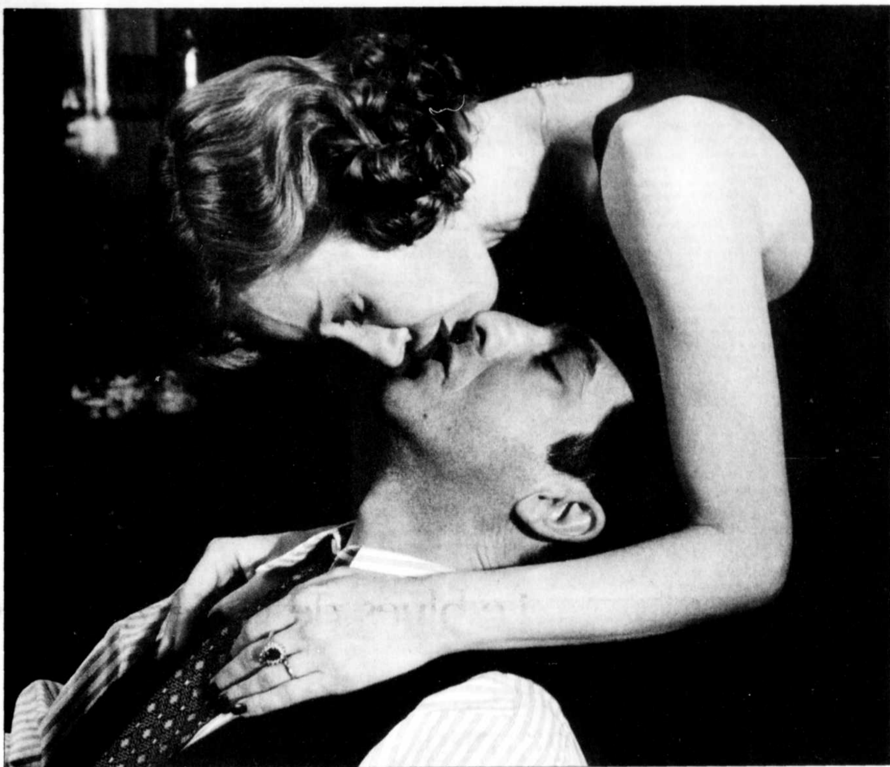
Une scène de «La Fuga», film argentin qui ouvrira le festival mercredi soir au Grand Théâtre de Québec.