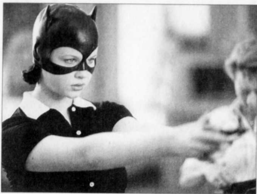
L'amère et grinçante comédie « Ghost World », de Terry Zwigoff, a été choisie comme film de clôture du festival, le 10 mars.