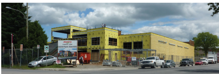
Épicerie Metro Plus en construction

Faire l'achat d'un terrain afin d'y construire votre résidence est probablement l'une des plus grandes décisions financières et de changement de style de vie que vous aurez à prendre au cours de votre vie. C'est pourquoi il faut s'assurer que votre nouveau quartier soit en mesure de répondre entièrement à vos besoins présents et futurs. Le Service d'urbanisme de la Ville de Lac-Mégantic se met à votre entière disposition pour répondre à vos questions. Un plan des terrains vacants disponibles pour la construction résidentielle est également disponible.