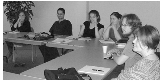
Participants à la formation Mise sur pied d'un journal culturel

Retour sur la formation : La formation La mise sur pied d'un journal culturel a marqué l'ouverture de la saison automnale du programme de formation continue. Les fondateurs du journal culturel de la Gaspésie ont transmis leurs expériences et leurs connaissances sur la réalisation d'un tel outil. Cet atelier a grandement outillé et a donné des ailes à notre équipe régionale vers la concrétisation du projet de création de notre propre journal culturel.