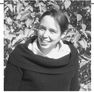
Judith Frappier.