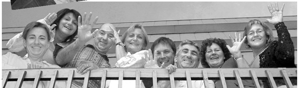
L'équipe du ministère de la Culture et des Communications.