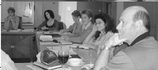
Conseil d'administration du CCAT