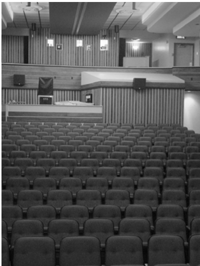
Intérieur du Théâtre du rift de Ville-Marie