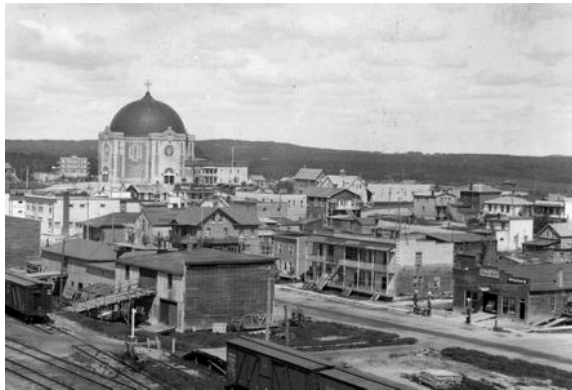
Vue générale d'Amos vers 1930 - Collection Société d'histoire d'Amos P013 S2/ P-377