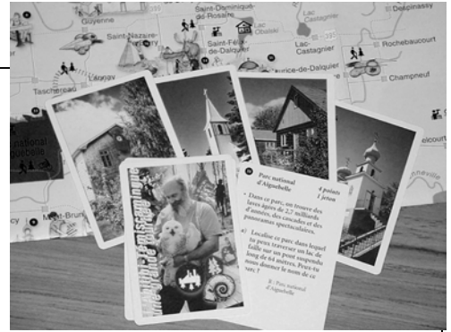
L'Abitibi-Témiscamingue, une grande tournée

Le jeu permettra sans nul doute aux plus curieux d'entre nous d'apprendre tout en s'amusant et surtout de découvrir tout les trésors qui se trouvent dans notre belle région! Le lancement officiel du jeu touristique « L'Abitibi-Témiscamingue, une grande tournée » aura lieu le mardi 18 octobre à 17 h 15 au Cabaret de la dernière chance. Pour ceux qui ne pourront être présents, le jeu sera disponible au Centre thématique fossilifère au coût de 12,00 $ et dans certaines librairies de la région.