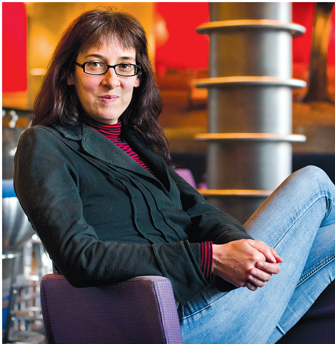
Catimini, de Nathalie Saint-Pierre, est raconté à hauteur d'enfant.

Pour illustrer son malaise, la cinéaste recourt à une image intéressante : « On a souvent une vision du problème à la Cendrillon, avec cette idée que, dès qu'on le sortira de son milieu, un enfant victime de maltraitance