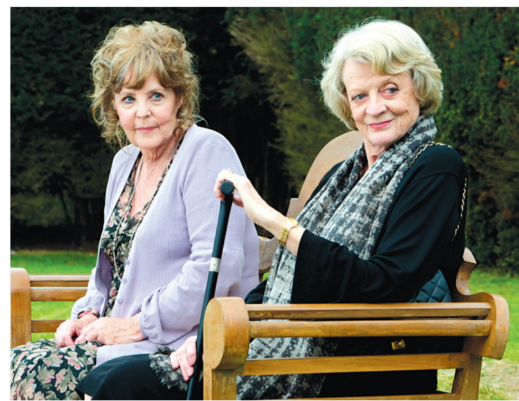
Film d'acteurs, Quartet donne à chacun sa partition à jouer.