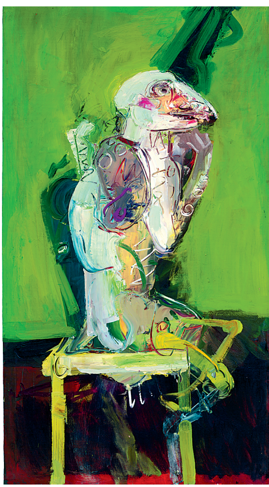
WhiteInsect, huile sur toile, 1963. D'Irene F. Whittome

«Pour la première fois, dit-elle, une œuvre me montre une direction. La réapparition de Room 901 s'est faite hors de mon contrôle.» La nouvelle direction l'amène, entre autres, à exposer pour la première fois dans un centre d'artistes. Tout un