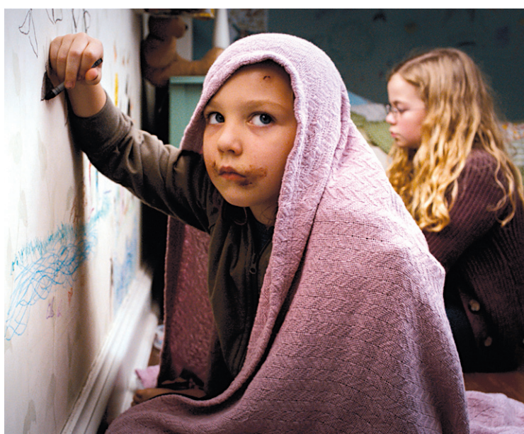
Le film repose sur les fragiles épaules de quatre jeunes interprètes.

Guillermo del Toro a donné au jeune cinéaste la chance, et les moyens, d'étoffer ce récit, d'y greffer une dimension tragique digne des drames les plus sordides qui tapissent les téléjournaux. Les petites Victoria et Lilly ont perdu leurs parents dans des circonstances effroyables et passent plusieurs années dans une cabane au fond des bois. Lorsqu'elles sont découvertes,