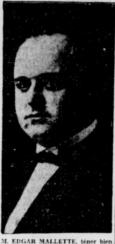
M. EDGAR MALLETTE, ténor bien connu, qu'on entendra en duo avec Mademoiselle Corinne Corvieux, dimanche soir, dans le programme de radio sans précédent offert par C.R.C.O. à l'occasion de la campagne de charité pour un objectif de $145,000.