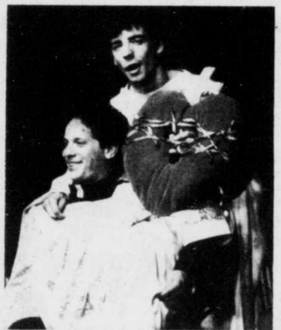
Une scène de la pièce "Roméo et Julien".

Tout cela se termine sur une prise de conscience du père, qui