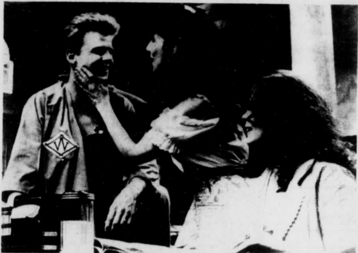
Une scène du film "Reviens Jimmy Dean, reviens"

plie également avec difficulté aux exigences de ses producteurs avec lesquels il a eu des démêlés devenus légendaires et qui ont fini souvent par son éloignement des studios.