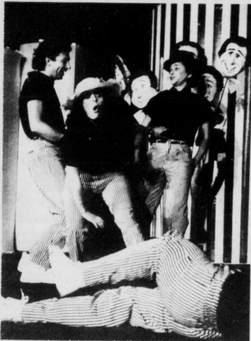
Un numéro interprété au ralenti, "Le gant de boxe", est probablement la meilleure interprétation de la première partie.