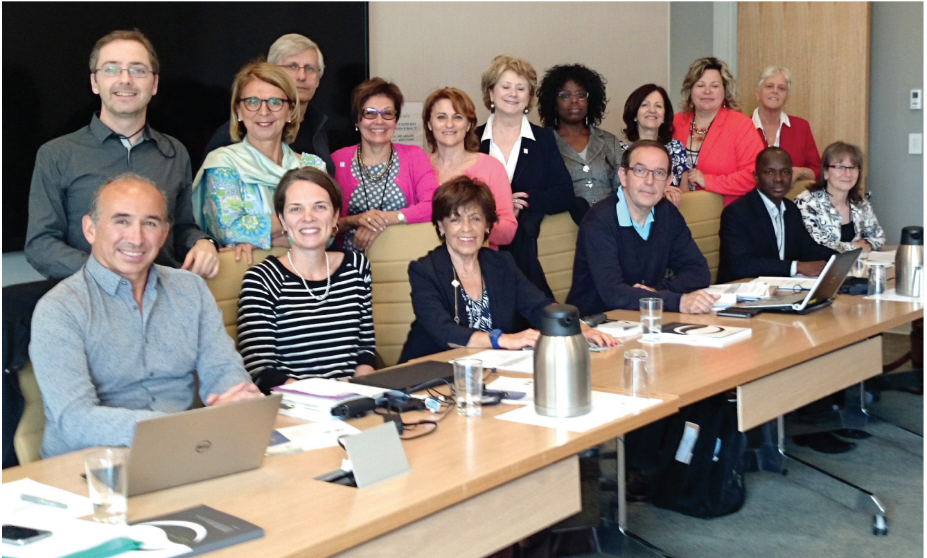
Membres du conseil d'administration 2014-2016

Le mandat actuel de tous les administrateurs du conseil d'administration du Secrétariat international des infirmières et infirmiers de l'espace francophone (SIDIEF) viendra à échéance à l'issue de l'assemblée annuelle du 29 avril 2016. Par conséquent, et conformément au règlement du SIDIEF, une élection doit être tenue en 2016 afin d'élire :