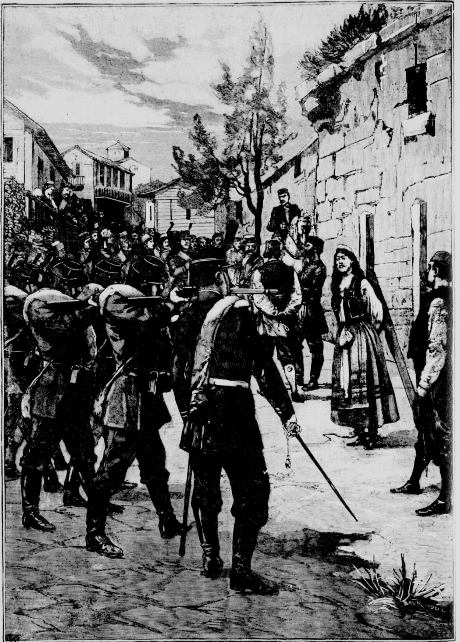
UNE EXÉCUTION EN SERBIE. — Une femme fusillée