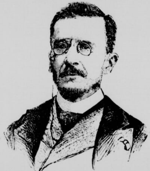
M. Ferdinand Brunetière, membre du comité