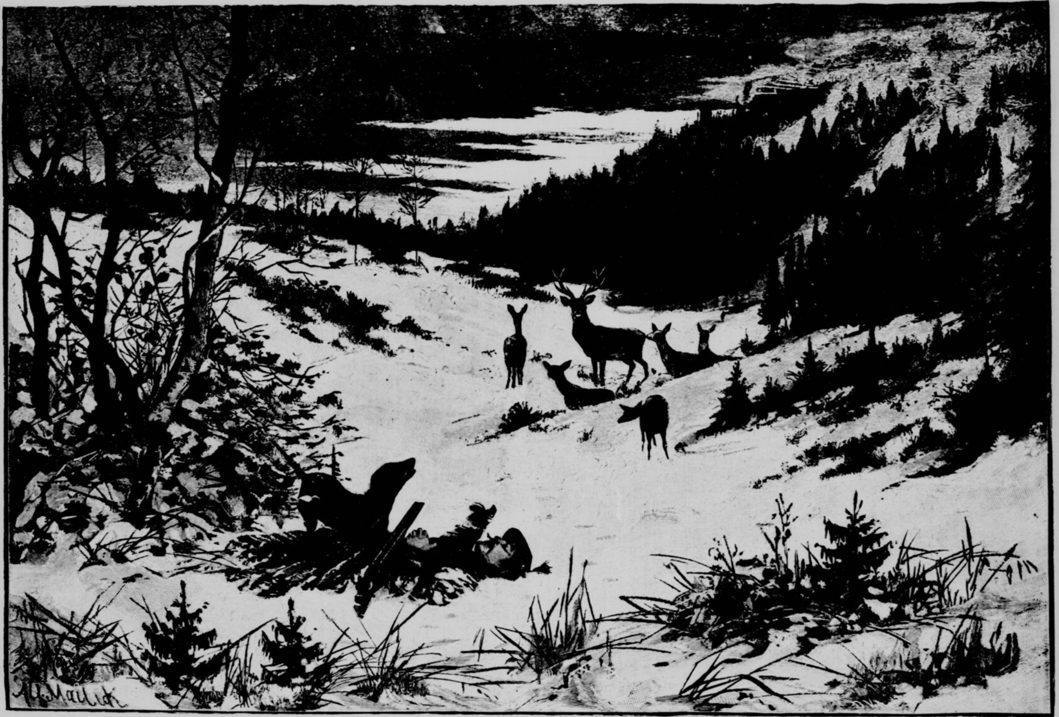
DANS NOS FORÊTS. -- Accident de chasse