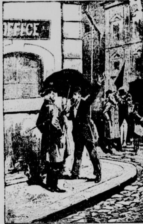
La quadruple masse noire se détachait, bizarre, sur l'azur intense du ciel.—Page 678, col. 3.

"C'est le 24 juin 1999, à quatre heures du soir, que, dans une plaine de la frontière mexicaine où il n'était jamais tombé une goutte de pluie, W. Benjamin Smithson créa, dans un ciel serein, de véritables cascades, et devint, par ce fait, le dispensateur de l'abondance des récoltes et le régulateur des biens de la terre.