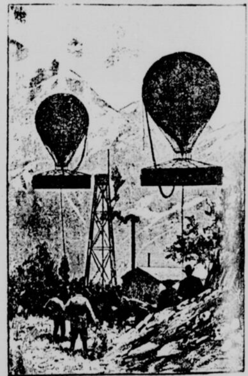
Les uns voulaient la pluie, les autres le beau temps.—Page 679, col. 1.

"On juge du retentissement qu'obtint le succès de Sir Benjamin. En quelques heures tout l'univers connut l'éclatante nouvelle. La vieille Europe crut