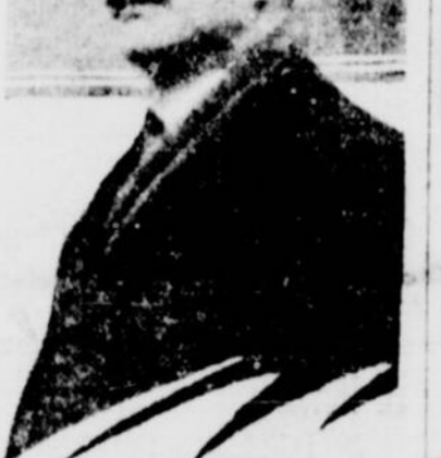
L'hon. M. P.-E. BLONDIN, ministre des Postes du Canada, qui est de passage à Montréal.

Un représentant de la PATRIE qui, indolument peut-être, l'interrogeait sur le but de son voyage, le collègue de Sir Robert Borden n'a pas caché que sa courte visite à la Métropole avait trait à l'organisa-