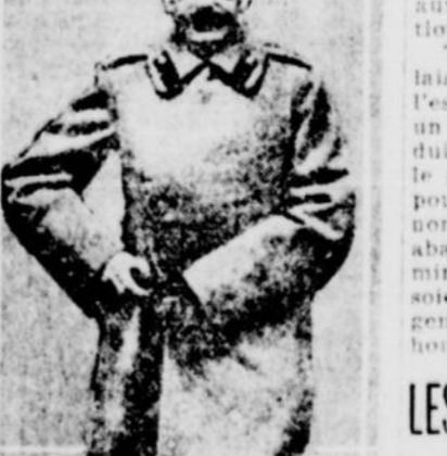
Le général BELIAEFF, le nouveau ministre de la guerre en Russie.

LONDRES, 18. — Le général Beliaeff vient d'être nommé ministre de la Guerre en remplacement du général Chouvaïeff qui a été nommé membre du Conseil de l'Empire d'après une dépêche de Petrograd à l'agence Reuter. Le général Beliaeff était auparavant assistant-mi-