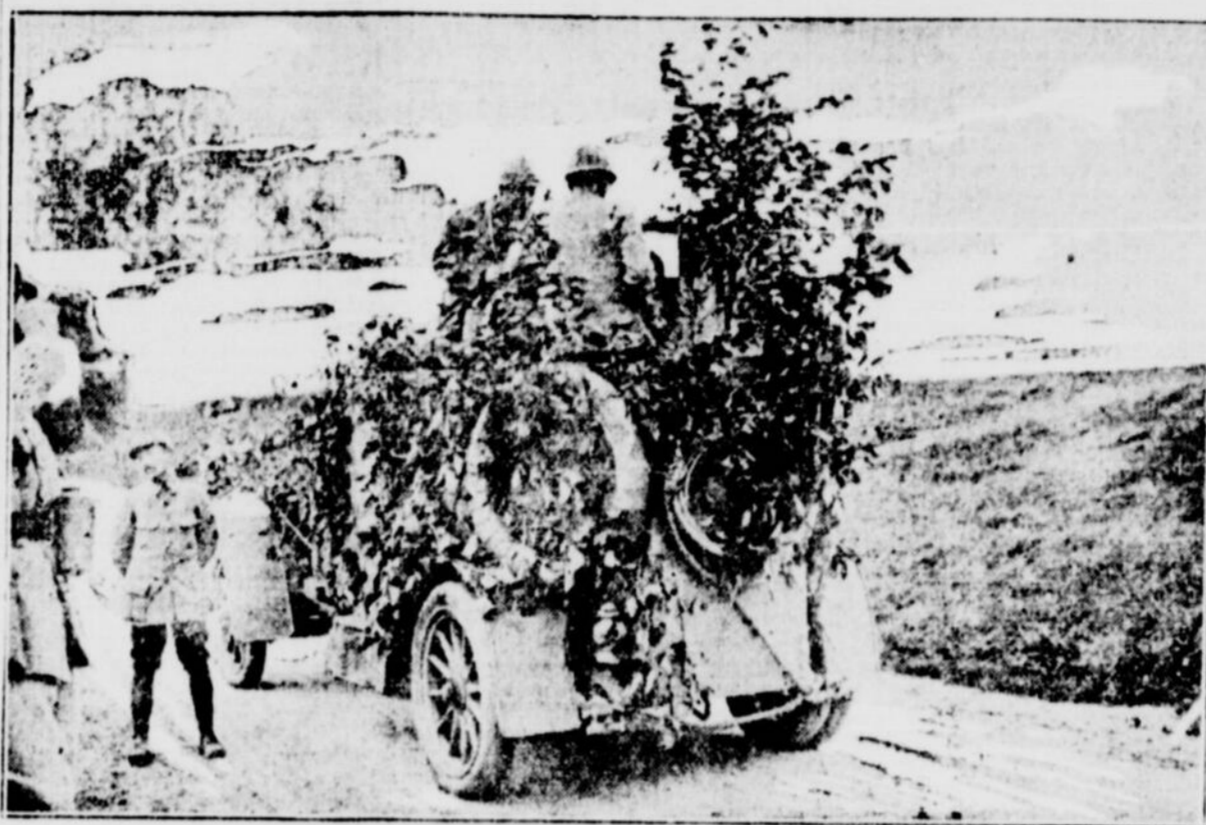
Une auto mitrailleuse française recouverte de branches d'arbres qui la rendent moins facile à repérer.