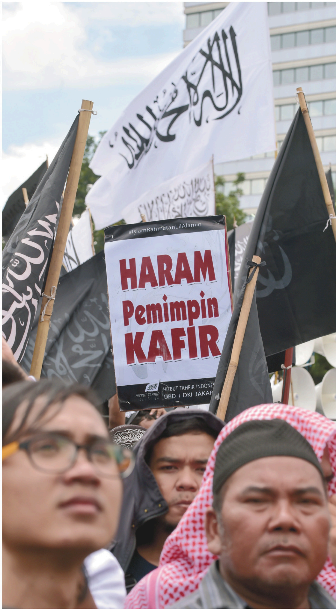
Des musulmans ont manifesté dimanche à Jakarta en soutien au Front des défenseurs de l'islam.

« Certains bureaucrates et certains hommes politiques opportunistes aiment [le Front des défenseurs de l'islam], car ils peuvent s'en servir comme arme, tout en affirmant agir au nom de l'islam »