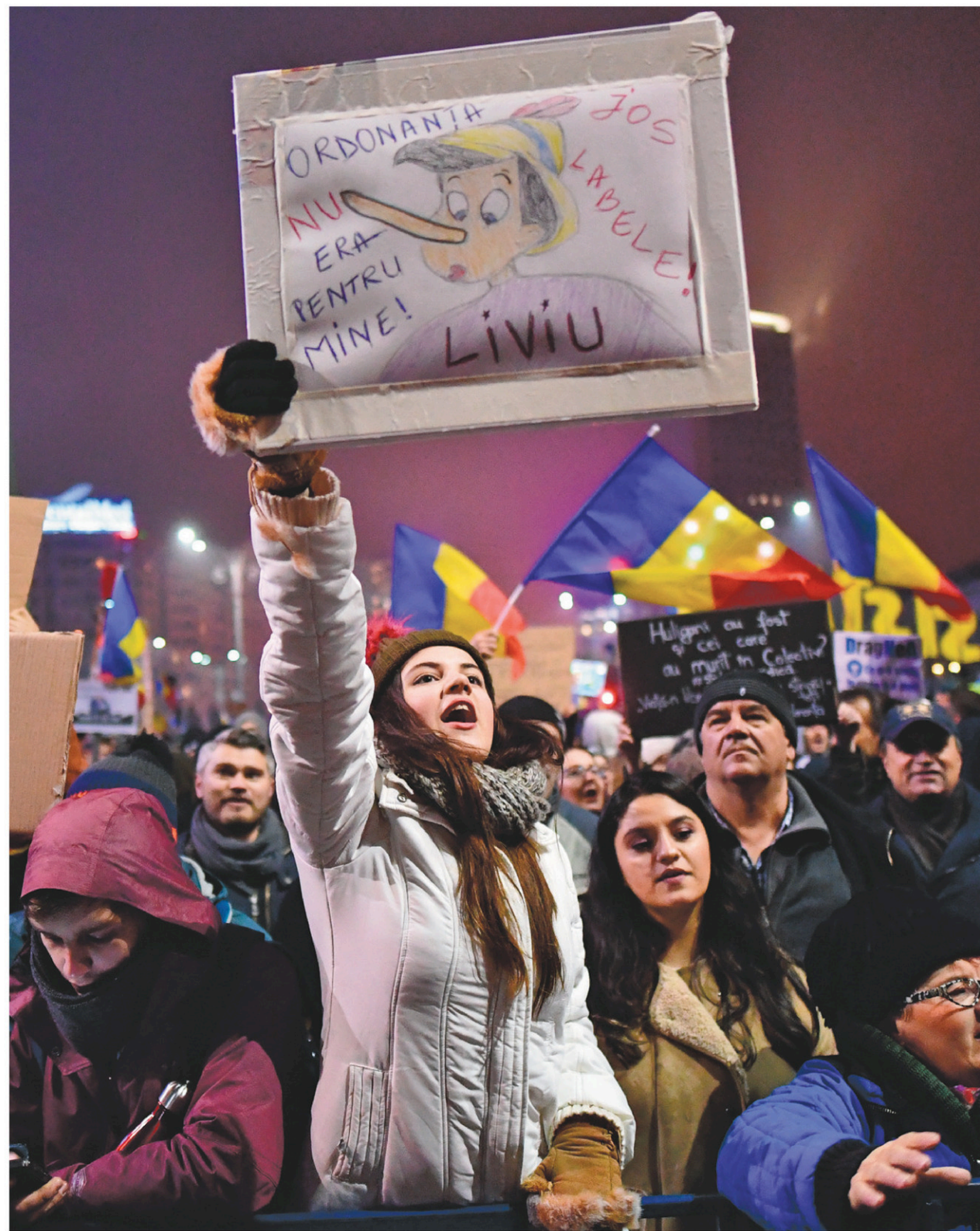
Des milliers de manifestants réunis à Bucarest ont demandé la démission du gouvernement roumain.

Un demi-million de Roumains ont manifesté dimanche soir, plus nombreux que jamais à exprimer leur mécontentement vis-à-vis du gouvernement, et autant dans une cinquantaine de villes à travers ce pays de 20 millions d'habitants.