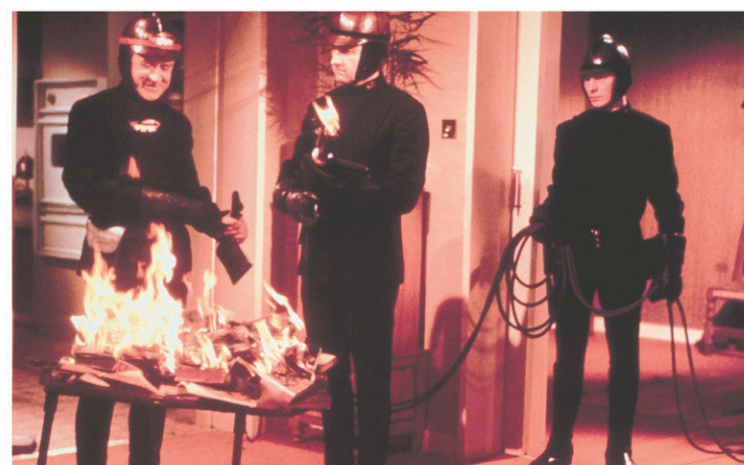
L'escouade des sapeurs-pompiers est chargée de débusquer et de brûler les livres dans le film Fahrenheit 451.

tati, patate...? » Dans le rôle de Linda, je la filmais généralement de profil, réservant la face pour le rôle de Clarisse. Son profil était justement très beau, à la manière d'un dessin de Cocteau; le nez droit fantastique et la lèvre supérieure très ourlée. Ce métier, qui décidément ne convient qu'à un homme sur dix, va comme un gant à neuf femmes sur dix. »