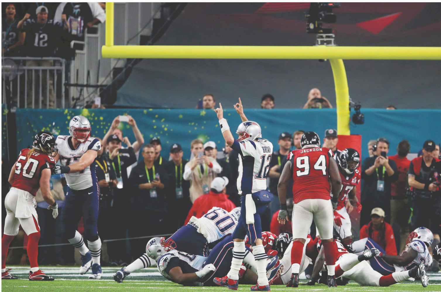
Tom Brady célèbre le touché d'un coéquipier au quatrième quart.