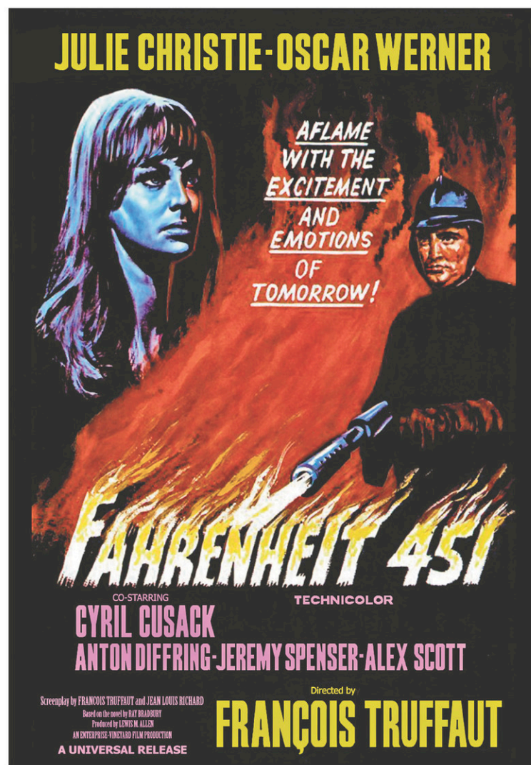
Affiche originale de Fahrenheit 451, de François Truffaut

À l'inverse, il n'a que de bons mots pour Julie Christie: « Julie Christie était épatante, aussi facile à travailler que Jeanne Moreau ou Françoise Dorléac; comme elles, faisant confiance, ne chipotant jamais et ne posant jamais de questions abstraites, du genre: "Que ressent-elle quand elle dit pa-