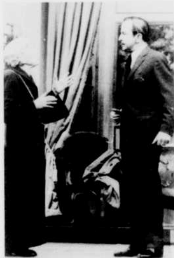
Même la vieille Mme Grombert ne pourrait nier l'évidence. Le temps est venu d'ouvrir les yeux à Hippolyte.

De Roussin, les téléspectateurs ont déjà vu, dans le cadre des soirées de théâtre en salle, des pièces telles que la Petite Hutte et Lorsque l'enfant paraît . Avec les Oeufs de l'autruche , celui qui, depuis des années, fait rire les fervents du théâtre de boulevard, use d'une formule pleine d'humour, de verve, d'ironie douce. Roussin dénonce ici non pas les tares sociales elles-mêmes, mais plutôt la bêtise de celui qui — la tête dans le sable comme l'autruche