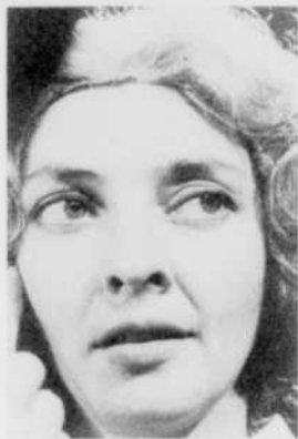
Animateurs: Suzanne Garcheau et Alain Gélinas. Réal.: Renault Gariépy.