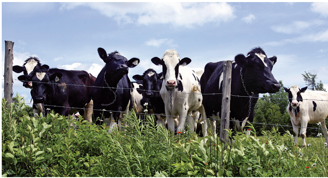
Le Québec vit une pénurie de médecins vétérinaires en région.

Le président de l'ordre français ne s'en formalise toutefois pas. «Ce dossier est extrêmement mineur», dit-il, indiquant que peu de vétérinaires français veulent pratiquer au Québec. «Ca relève plus du symbole dans le cadre de l'amitié franco-québécoise que de la nécessité.»