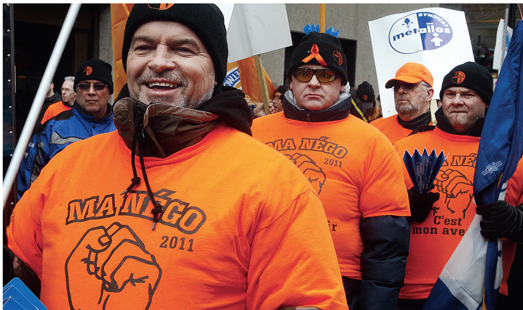
Il y a un an, alors que le lockout battait son plein à l'aluminerie d'Alma et que les contribuables québécois le finançaient par l'achat d'électricité, la future première ministre Pauline Marois s'était engagée à ce qu'il n'y ait pas d'avantages indus donnés à certaines entreprises par rapport à d'autres.

Les prix de l'aluminium sont à la baisse et les surplus d'inventaires mondiaux sont impor-