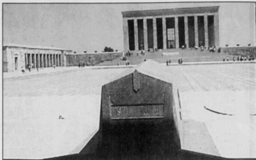
Presses-Consil Véritable lieu de pèlerinage pour les Turcs, le mausolée d'Ataturk, à Ankara, est un monument à la mémoire du père de la République de Turquie, Mustafa Kemal Ataturk.

Les mets turcs sont raffinés et savoureux. Et, contrairement à la croyance populaire, ils ne sont pas trop épicés.