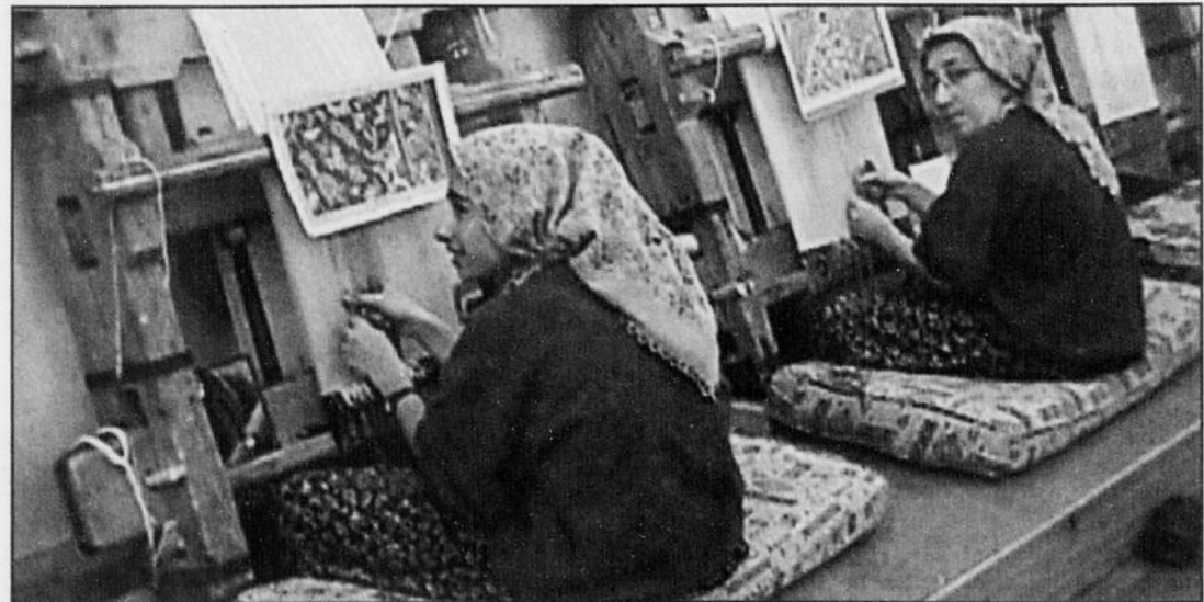
L'État turc a créé des écoles pour perpétuer la tradition de la fabrication des tapis. Sur la photo, des jeunes femmes au travail dans un atelier/école de Hereke.

Et après tout, quoi de plus agréable que de parler affaires avec un marchand turc ou kurde en sirotant un bon thé aux pommes? Dites-vous que ça ne vous arrivera pas souvent!