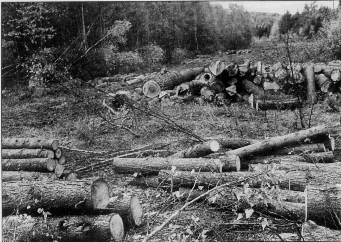
En cinq ans, le Québec a vu disparaître de 5 à 13,8 pour cent (selon les régions) de sa forêt privée.

L'exploitant, bien que reconnu coupable d'avoir effectué une coupe de plus de 40 % dans une érablière, une infraction à l'art. 27 de la Loi, ne se vit imposer aucune amende hors l'obligation de clôture. La propriété fut reven-