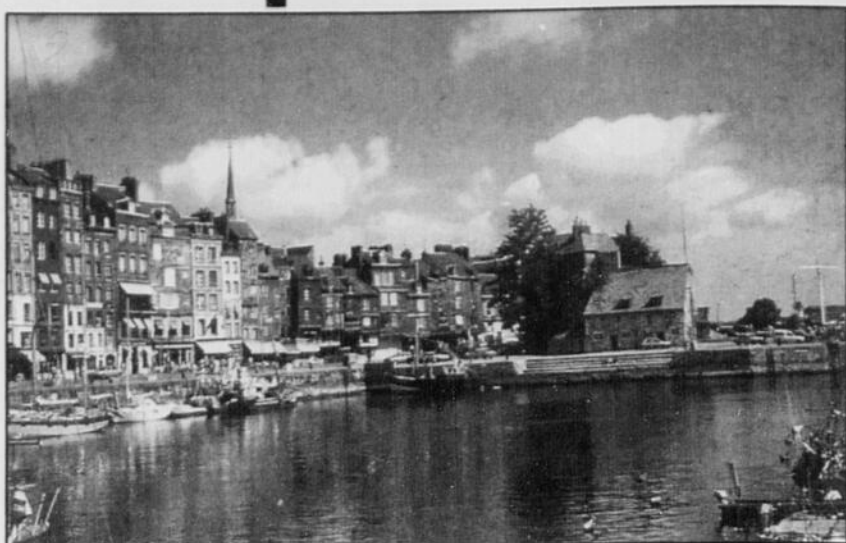
C'est vraiment époustouflant d'apercevoir Honfleur et on dirait que nos deux yeux ne suffisent pas à tout voir. À gauche sur le quai, face au bassin intérieur, c'est l'église Sainte Étienne (1432) qui abrite aujourd'hui le Musée du Vieux Honfleur, où tout autour, dans les antiques rues du quartier, s'ajoutent l'ancienne prison.

Personne ne peut rester insensible aux charmes de Honfleur, car on dirait un décor d'opérette! Son vieux port, entouré d'extraordinaires maisons de bois du XVI e et XVII e siècles, toutes avec un revêtement d'ardoises gris-bleu, pour mieux les protéger contre les intempéries, vous administre à première vue, un choc violent d'admiration. Le site même, la beauté des lieux, la mer, l'architecture, les parcs, les calèches, les terrasses, les vieux monuments historiques, les fleurs, les galeries d'art, les bateaux, les pêcheurs, l'animation et cette impressionnante Lieutenance, ancienne maison du Gouverneur à l'entrée du Vieux Bassin et sur le mur de laquelle on peut y lire une plaque consacrée au départ de Samuel de Champlain pour venir fonder Québec en 1608...Ouf!