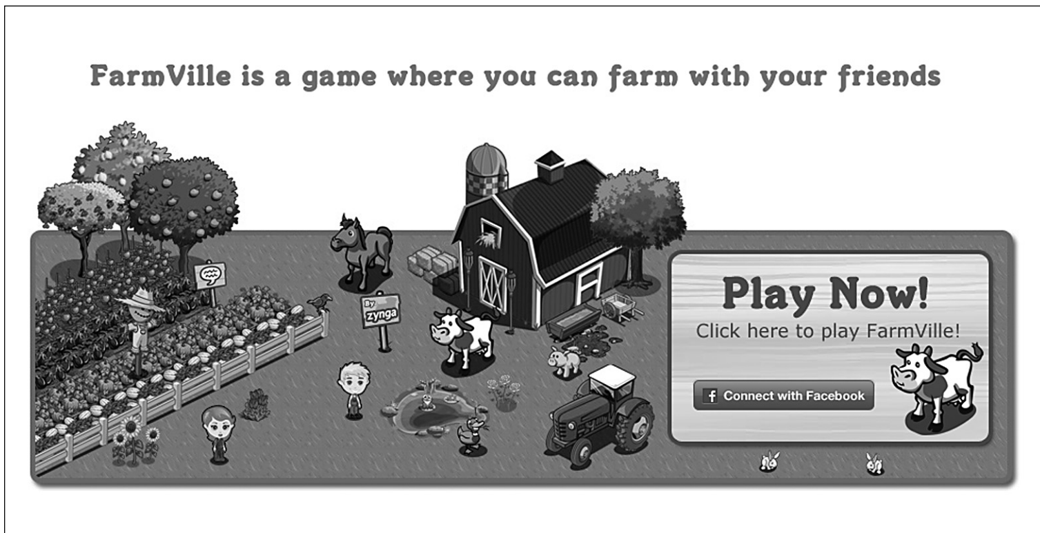
Des jeux comme FarmVille appellent à la détente et à l'évasion. Dans un espace virtuel donné, l'internaute est invité à organiser son monde en plantant ici des parcelles de brocoli et en élevant des poules.

La recette est connue. Elle a fait ses preuves dans le passé avec des jeux de simulation comme SimCity ou encore Les Sims, deux classiques de