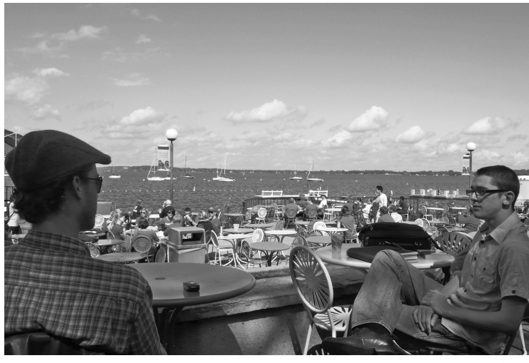
Le Wisconsin borde le lac Michigan, qui est le seul à ne pas être partiellement canadien; c'est donc celui qu'on connaît le moins.

Le centre-ville de Madison s'avère très spécial. Géographiquement, c'est l'isthme formé par deux beaux lacs ronds (les lacs Mendota et Monona). Cet isthme de quelques kilomètres de longueur et d'environ un kilomètre de largeur est le site du magnifique State Capitol (un des plus beaux bâtiments législatifs aux États-Unis) et des nobles bâtiments administratifs d'État, de