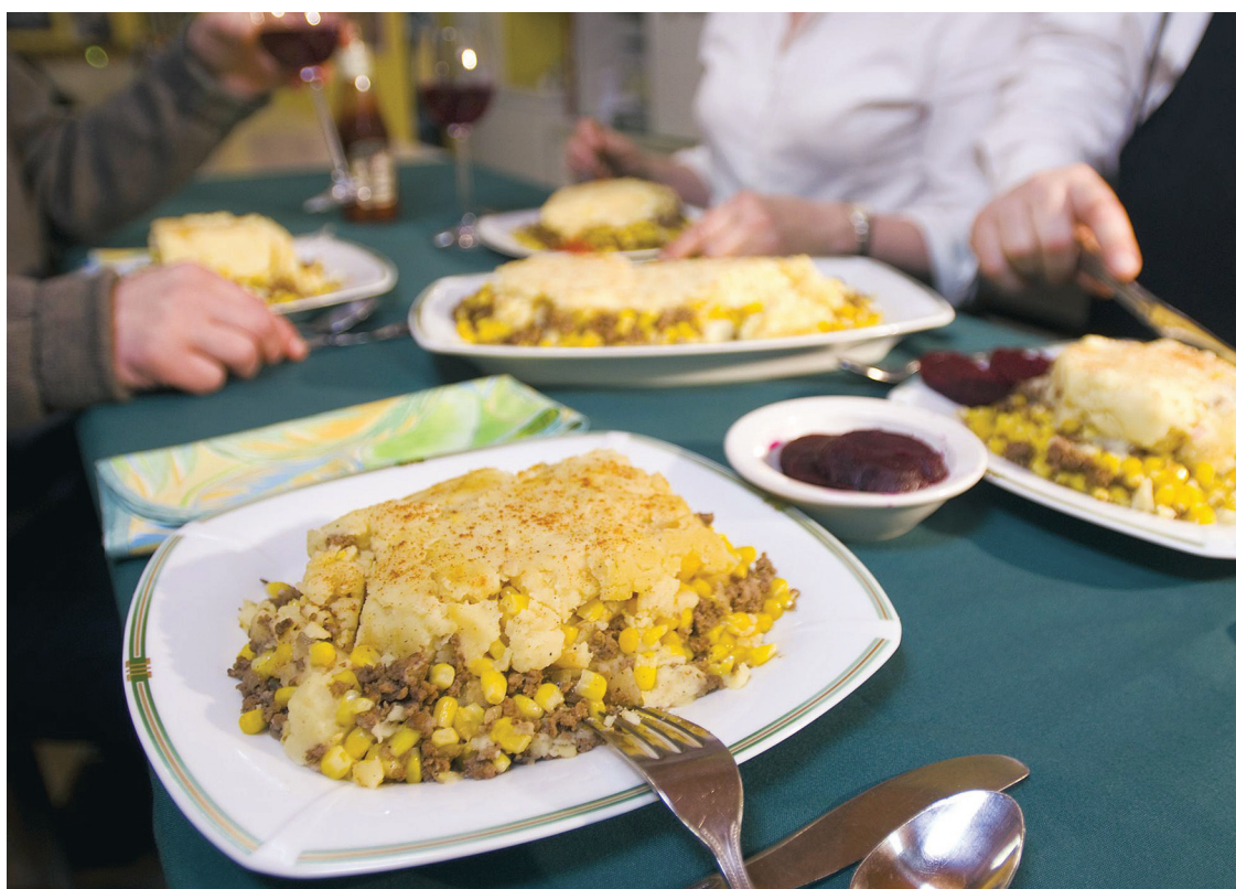
PEDRO RUIZ LE DEVOIR

Les plus grands chefs du monde le disent souvent: les recettes traditionnelles de leurs grands-mères sont celles qu'ils préfèrent. Combien hésiteront à inviter un chef à leur table, intimidés