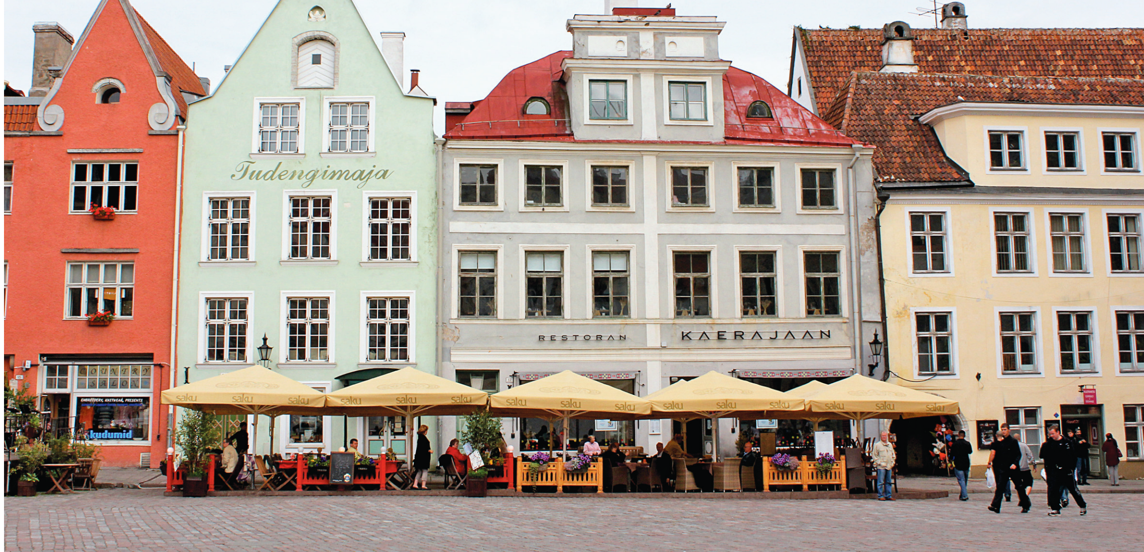
La place Raekoja à Tallinn