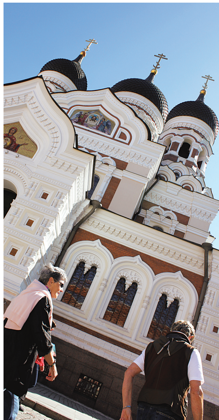
La cathédrale Saint-Alexandre-Nevski à Tallinn

■ Lire aussi «La culture d'abord!» en page D 3