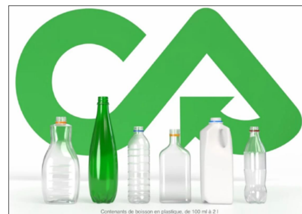
Contenants de boisson en plastique, de 100 ml à 2 l

Quant aux détaillants à plus petite superficie, qui recueillent déjà la consigne, la décision d'élargir le tout leur revient. Comme ils n'ont pas cette obligation, la grande majorité a décidé de ne pas offrir ce service supplémentaire, du moins, pour l'instant.