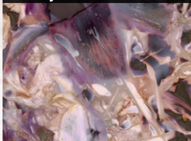
Benjamin Perron Et si le soleil ne se levait pas?

Heures d'ouverture : mardi au samedi de 10h à 17h