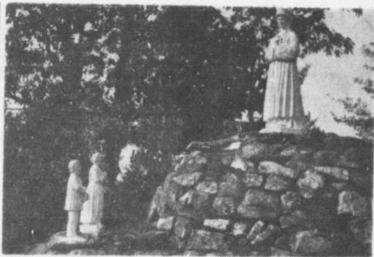
Nous apercevons sur cette photo la statue de Notre-Dame-de-la-Salette, qui est installée au sommet du mont Salettin, tous les pèlerins qui assisteront au grand pèlerinage du 24 août, auront l'occasion de prier aux pieds de cette statue, et lui demander de conserver la paix dans le monde.