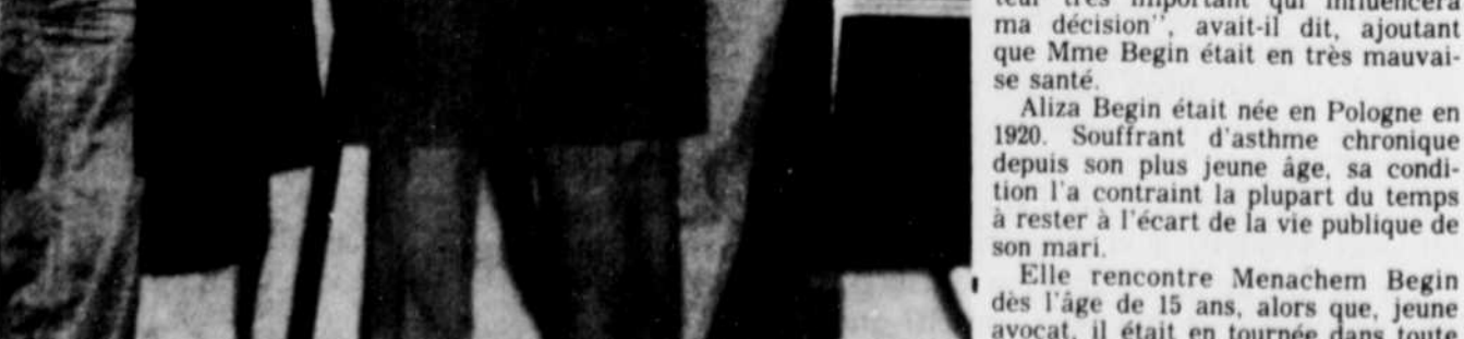
L'honorable Hugues Lapointe

Son appartenance au régiment de la Chaudière lui vaudrait des funérailles militaires.