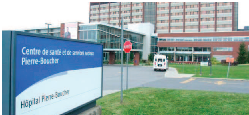
L'hôpital Pierre-Boucher

La Fondation Hôpital Pierre-Boucher se dit « vivement préoccupée » que la deuxième phase du projet d'agrandissement et de modernisation du centre hospitalier de Longueuil soit de nouveau « sur le glace », ne figurant pas à la liste des projets du Plan québécois des infrastructures (PQI) 2024-2034.