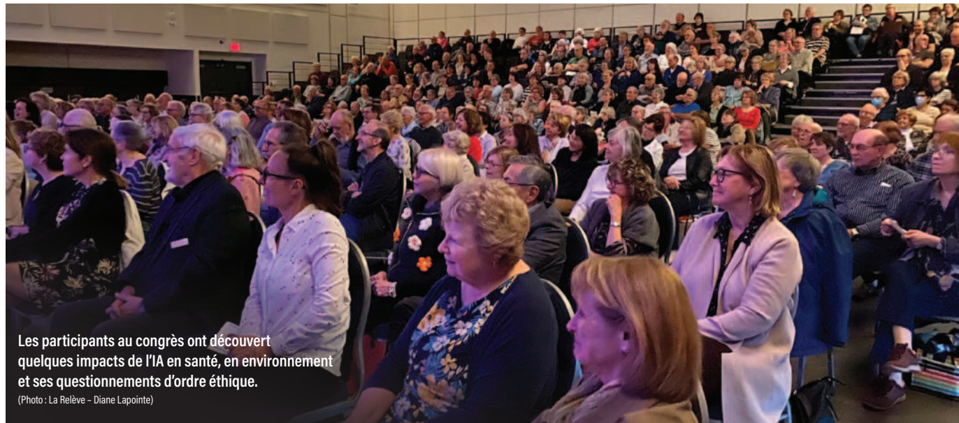
Les participants au congrès ont découvert quelques impacts de l'IA en santé, en environnement et ses questionnements d'ordre éthique.

Bien que l'IA existe depuis 1959, elle se développe à une vitesse phénoménale