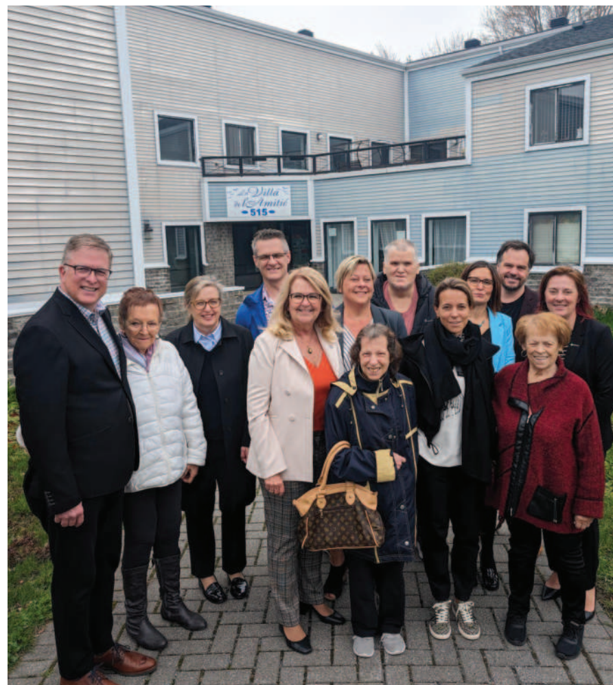
La Villa de l'Amitié a accumulé au fil du temps un retard d'entretien trop avancé pour penser le rénover.

Cette nouvelle est bien accueillie par le conseil municipal puisque les logements sont peu nombreux sur le territoire julévillois. Ainsi, selon une étude publiée par le site Point2Homes en 2022, c'est à Sainte-Julie que le taux de vacances serait le plus bas au Canada, soit moins de 1%. Quant aux logements actuels à louer, leur loyer est peu