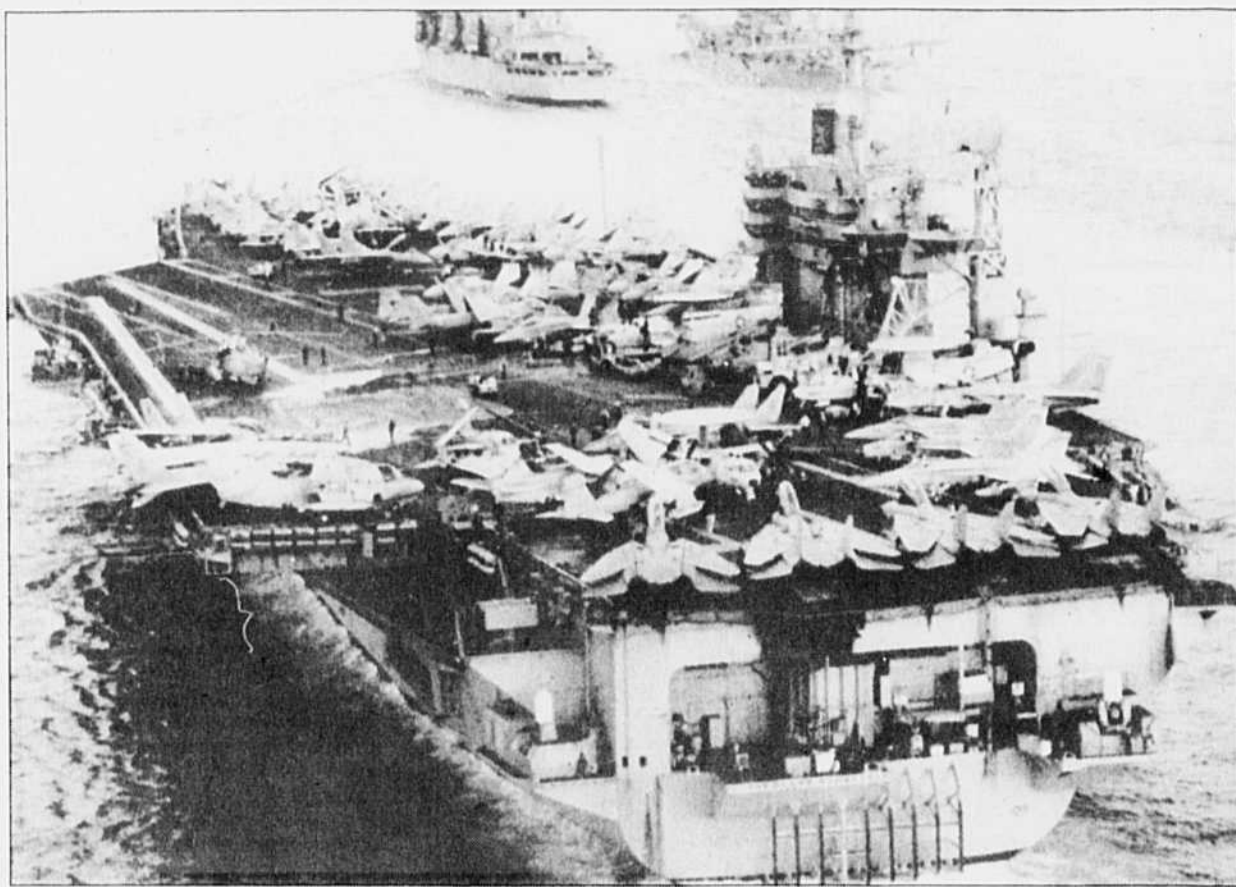
Le porte-avions américain USS Theodore Roosevelt vogue sur les eaux du golfe Persique accompagné de deux navires de soutien. Ses dizaines d'avions, alignés sur le pont, participent quotidiennement aux bombardements du Koweït et de l'Irak.

LE CAIRE (AFP) — Le président égyptien Hosni Moubarak a sévèrement critiqué hier les « formules inventées de toutes pièces par les complices » de l'Irak pour arrêter la guerre du Golfe. Dans une allocution prononcée devant des ulémas (dignitaires religieux) à l'Université d'Al-Azhar (la plus importante université théologique de l'islam sunnite), il a réaffirmé que « la véritable initiative doit être prise par les responsables du drame, et doit comporter l'annonce par l'Irak de son retrait du Koweït ». M. Moubarak a ensuite estimé que « ceux qui disent vouloir une solution arabe ne veulent en fait aucune solution, et leurs pseudo-initiatives sont autant d'artifices ». La neutralité dans cette guerre équivalait à soutenir le crime », a-t-il affirmé en justifiant l'engagement militaire de l'Égypte qui a déployé quelque 35 000 soldats en Arabie saoudite. Le chef de l'État a ensuite raillé « l'affirmation que la libération de Jérusalem passe par le Koweït », et a longuement dénoncé l'utilisation de l'Islam par ceux qui ont des ambitions personnelles, dans une allusion au président Saddam Hussein.