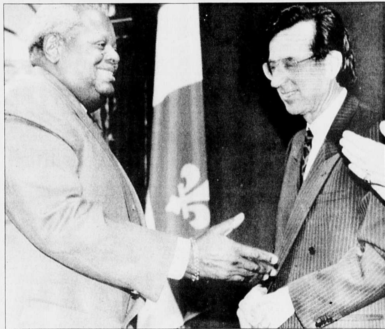
Le célèbre pianiste de jazz Oscar Peterson et 25 autres personnalités ont reçu hier l'Ordre national du Québec des mains du premier ministre Robert Bourassa. Autres informations page A-3.