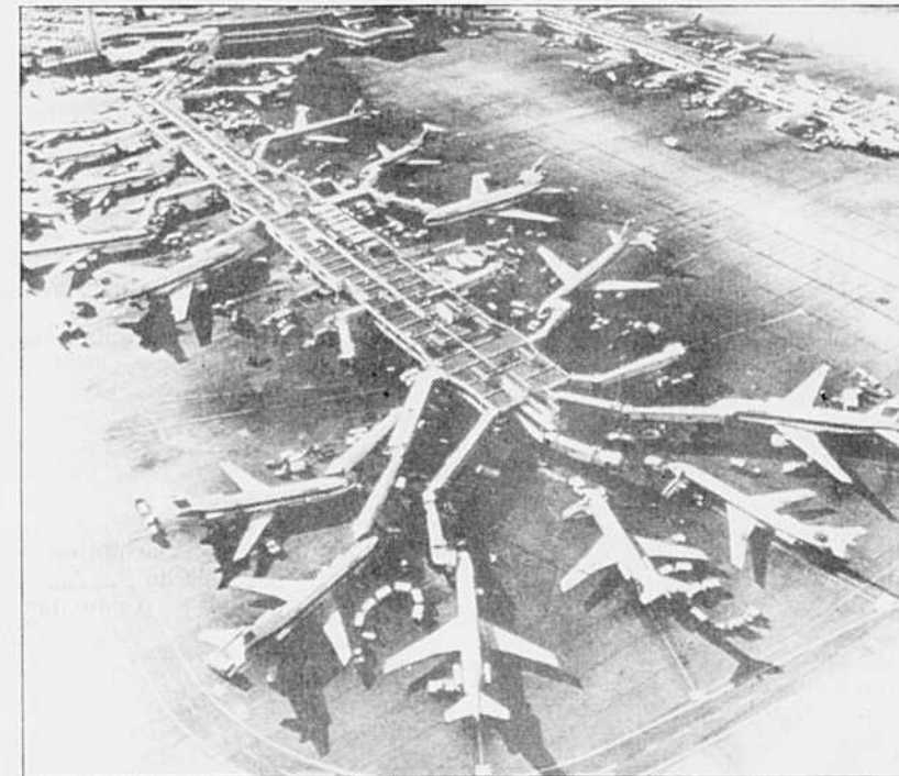
La guerre du Golfe et la récession entraînent une forte baisse du trafic aérien. Ici, une vue de l'aéroport de Denver.

British Airways a pour sa part annoncé la suppression de 4600 emplois et la mise en chômage technique de 2000 salariés supplémentaires qui recevront seulement une moitié de