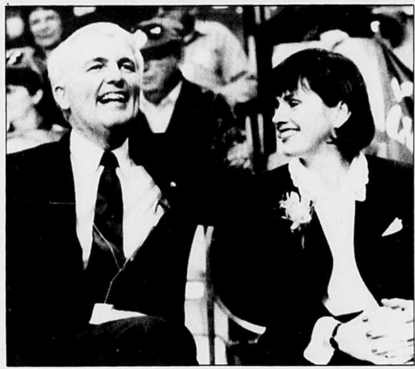
Le futur premier ministre de Nouvelle-Écosse, ici avec son épouse lors du congrès au leadership qui a consacré sa victoire au troisième tour de scrutin.

nistre de l'Industrie depuis 1988, prédit une crise fiscale imminente, préparant ainsi le terrain en vue de compressions budgétaires qui laissent présager moins de ministères, moins de fonctionnaires et moins de subventions aux entreprises. Don Cameron, âgé de 44 ans, arrive en poste à un moment où les conservateurs sont au plus bas dans l'opinion publique, peu enclins à leur garder sa confiance après des années de patronage et de scandales à saveur de corruption. S'il a mené une campagne discrète pour le leadership, il n'a pas hésité à hausser le ton quand sa propre intégrité était mise en doute. Réputé avoir un tempérament bouillant, le prochain premier ministre de Nouvelle-Écosse soutient au contraire qu'il n'est pas un violent. Mais quelquefois, admet-il, il faut « faire peur » aux gens.